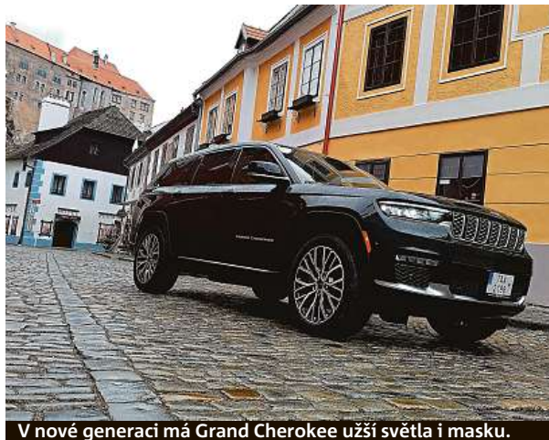
V nové generaci má Grand Cherokee užší světla i masku.

Síla motoru 268 kW je na 2,5tunové auto adekvátní, motor má krásný zvuk. Všechna kola mají nezávislé zavěšení a neztratí se ani v terénu – verze Summit má vedle vzduchového odpružení systém Quadra-Drive II doplněný o zadní elektronicky řízený diferenciál. PETR HOLEČEK