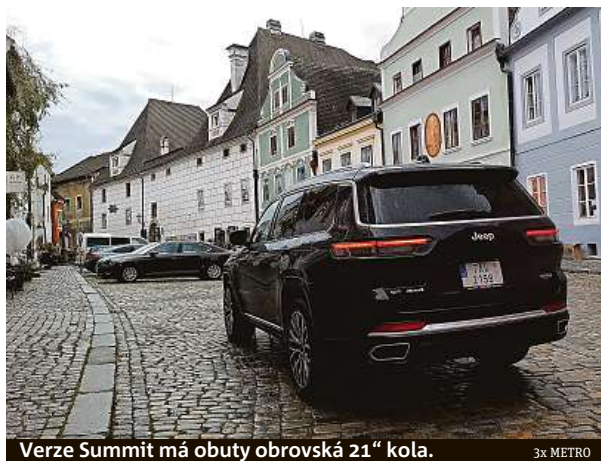
Verze Summit má obuty obrovská 21" kola.