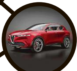
Alfa Romeo Tonale