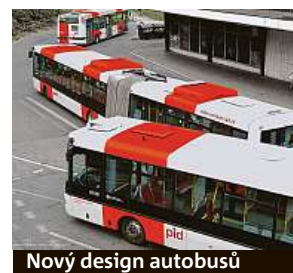
Nový design autobusů

Akce platí v prodejnách Albert hypermarket od 20. 12. do 24. 12. 2021 nebo do vyčerpání zásob v jednotlivých prodejnách. Každý týden za vás hlídáme nejnížší akce na trhu.