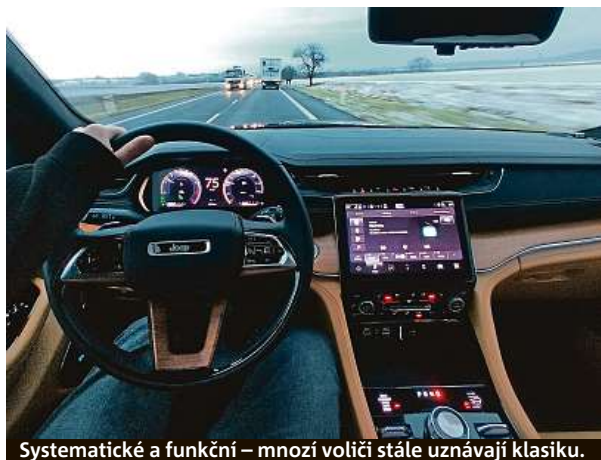
Systematické a funkční – mnozí voliči stále uznávají klasiku.