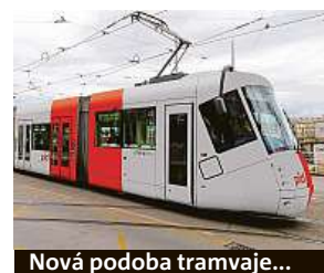
Nová podoba tramvaje...