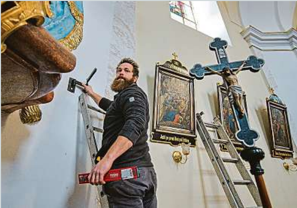
Jejich práce v tornádem postižených oblastech nekončí.