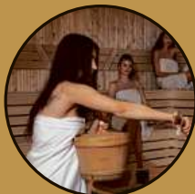
Exkluzivní ubytování a wellness