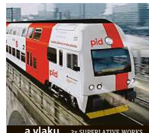
... a vlaku 3x SUPERLATIVE WORKS