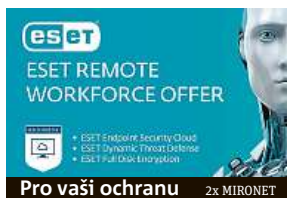
Pro vaši ochranu 2x MIRONET

Letošní nenadálá situace mnohé uzavřela uvnitř domovů. Zaměstnavatelé proto začali urgentně řešit, jak umožnit svým zaměstnancům vytvořit si kancelář v jejich vlastním obýváku. I práce na dálku má ale svá bezpečnostní úskalí a rizika. Zabezpečte své pracovní stanice proti ransomwaru i zero day útoky s balíkem ochrany ESET PROTECT Advanced, který chrání zařízení firmy využívající práci zaměstnanců na dálku.