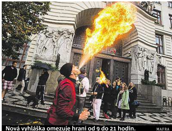
Nová vyhláška omezuje hraní od 9 do 21 hodin.

Zároveň budou zakázána vystoupení se zvířaty, na území památkové rezervace bicí nástroje, dudy, pikoly a hoboje, saxofony bez dusítek a elektrické zesilovače. Pouliční umění neboli busking Praha reguluje od roku 2013, občané zejména Prahy 1 si ale stále stěžují na hluk či opakující se hudební produkci. Nově tak vyhláška vystupování omezila místně i časově.