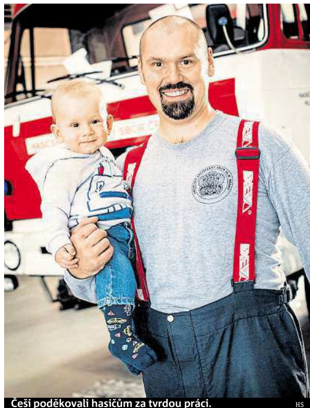
Češi poděkovali hasičům za tvrdou práci. HS