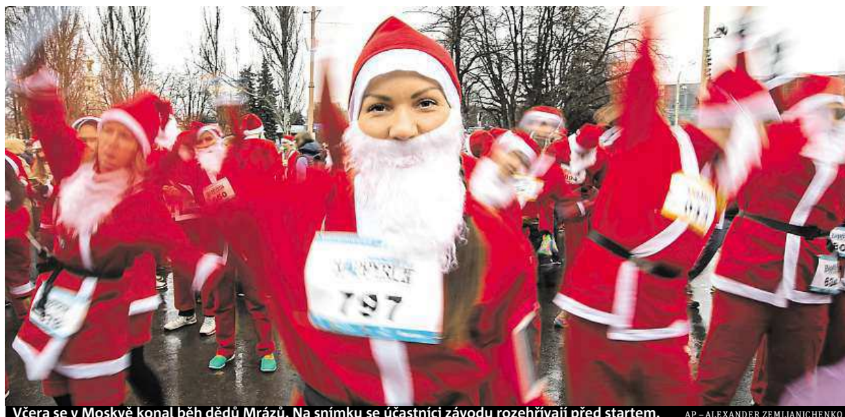
Včera se v Moskvě konal běh dědů Mrázů. Na snímku se účastníci závodu rozehřívají před startem.

Štědrý den. Svě brány otevře Trojský útulek i exotický skleník. Zoo. Návštěvníci sem mohou přinést dárky pro zvířata a spatřit zde zlatá prasátka. Památky. Sváteční den můžete strávit i ve Chvalském zámku STRANA 2