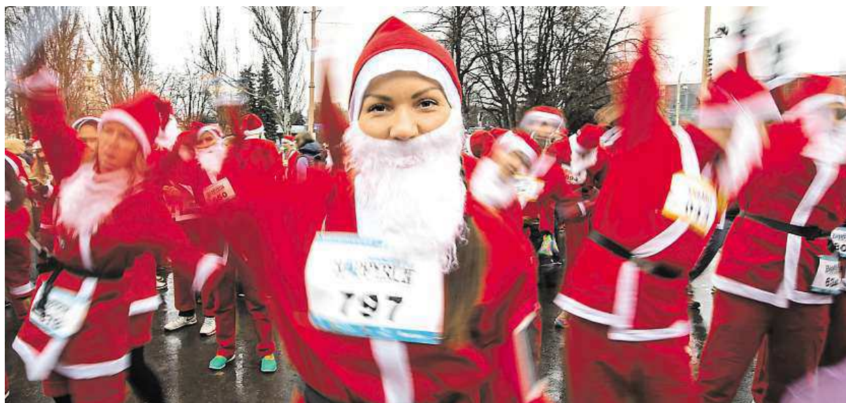
Včera se v Moskvě konal běh dědů Mrázů. Na snímku se účastníci závodu rozehrávají před startem.

Otevřený oheň. Okolo Štědrého dne nenechávejte svíčky na adventním věnci či vánočním stromku bez dozoru. Silvestr. Oslavu může pokazit nekvalitní pyrotechnika nebo nadměrná konzumace alkoholu STRANA 4