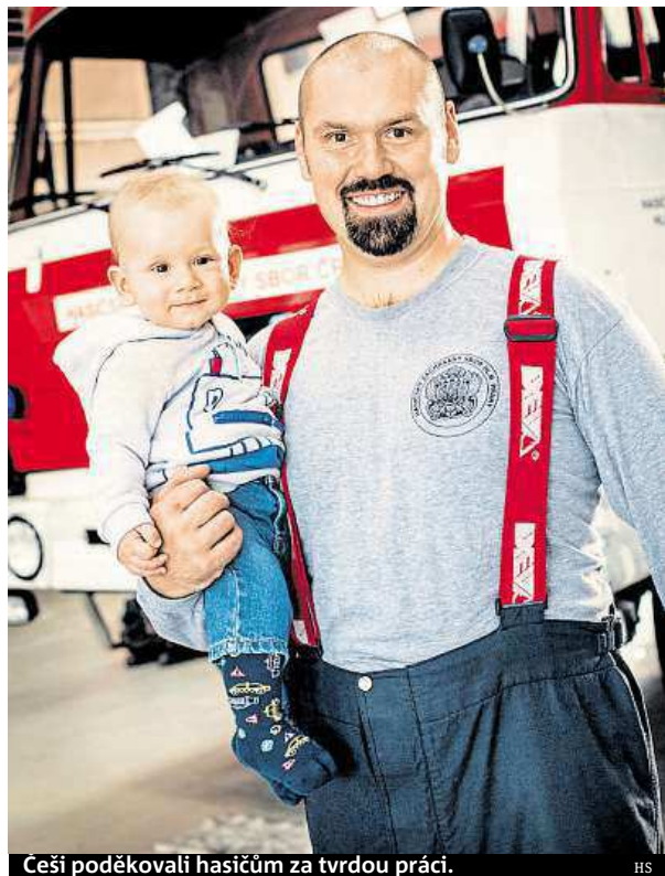
Češi poděkovali hasičům za tvrdou práci. HS