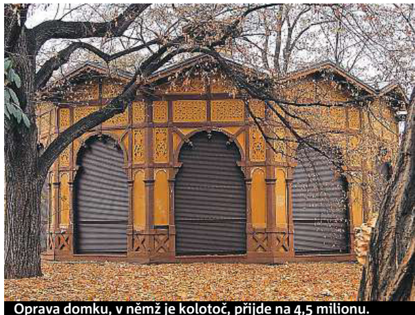
Oprava domku, v němž je kolotoč, přijde na 4,5 milionu.