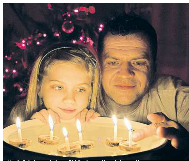
Ke Štědrému dni patří i řada rodinných tradic.