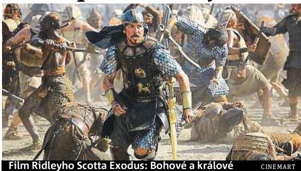
Film Ridleyho Scotta Exodus: Bohové a králové

Jedinou nekomedii je mezinárodní historický film o Mojžíšovi pod názvem Exodus: Bohové a králové v režii světově známého a cenami ověřeného Ridleyho Scotta. Z historických filmů jej proslavil například Gladiátor . METRO