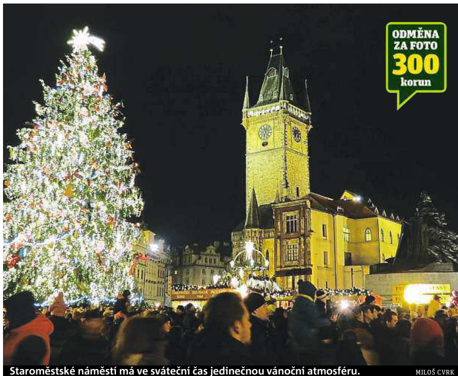
Staroměstské náměstí má ve sváteční čas jedinečnou vánoční atmosféru.

Moc bych si přál, aby nám lidé přispěli na opravu letenského kolotoče, kam jsme se chodili vozit jako děti. Teď asi žádné vlastní přání nemám. Když jsem byl malý, přál jsem si cestu kolem světa, ale to se mi nikdy nespěnilo. Sice jsem se naučil stopovat a kus světa objel, ale celý to nebyl.