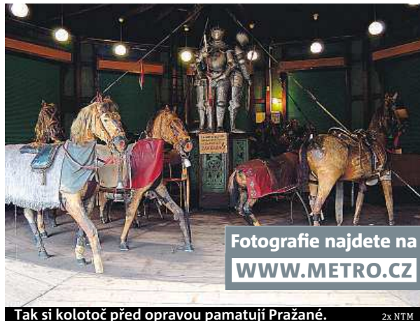
Tak si kolotoč před opravou pamatují Pražané.

Nenápadný unikát zapadá listím. Vše se změní příští rok.