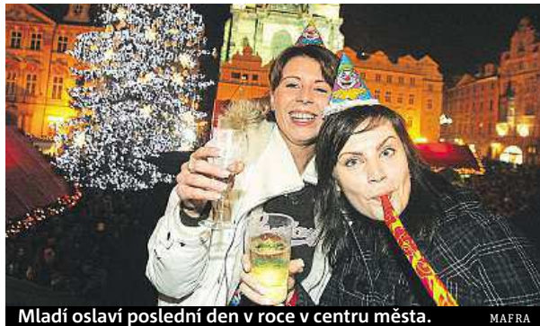
Mladí oslaví poslední den v roce v centru města. MAIRA

Kolem 550 korun v průměru utratíme za silvestra. Velké vzrůšo za to ale nečekejte.