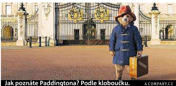
Jak poznáte Paddingtona? Podle kloboučku.