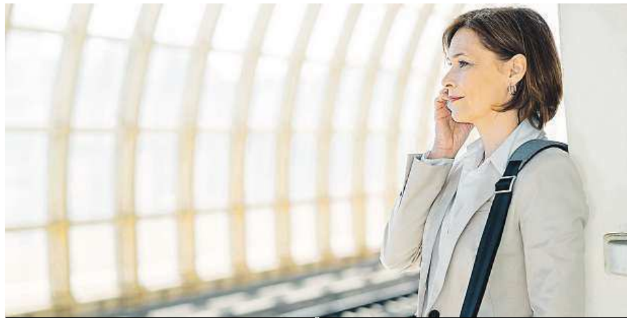
Dojíždět déle než hodinu do práce se většině Čechů nechce.

Rozhodnutí je podle webu BBC závazné pro všechny země Unie. ČTK