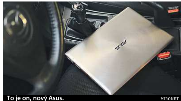
To je on, nový Asus.

Viditelné sblížení je i v displejích – pro telefony už není problém mít stejné rozlišení jako na televizi s metrovou úhlopříčkou. Samo se proto nabízí využití obojího ve velmi výkonném a zároveň lehkém počítači na cesty. Taková sestava by nemusela mít problém ani s hrami, přestože její zacílení bude asi mířit spíše k byznysu.