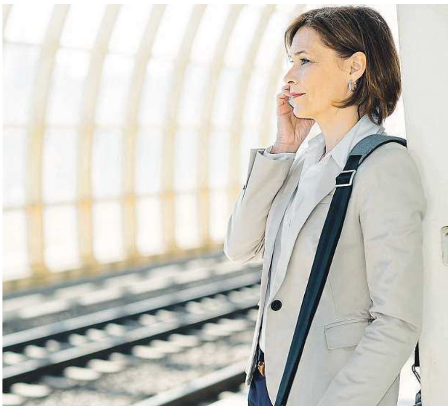
Dojíždět déle než hodinu do práce se většině Čechů nechce.

Český trh práce mohou ovlivnit i události na meziná-