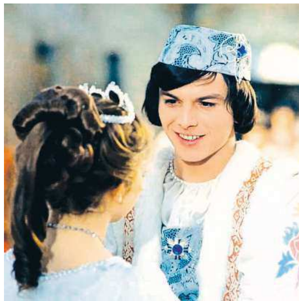
Za celou dobu se ani jednou nepolíbil.