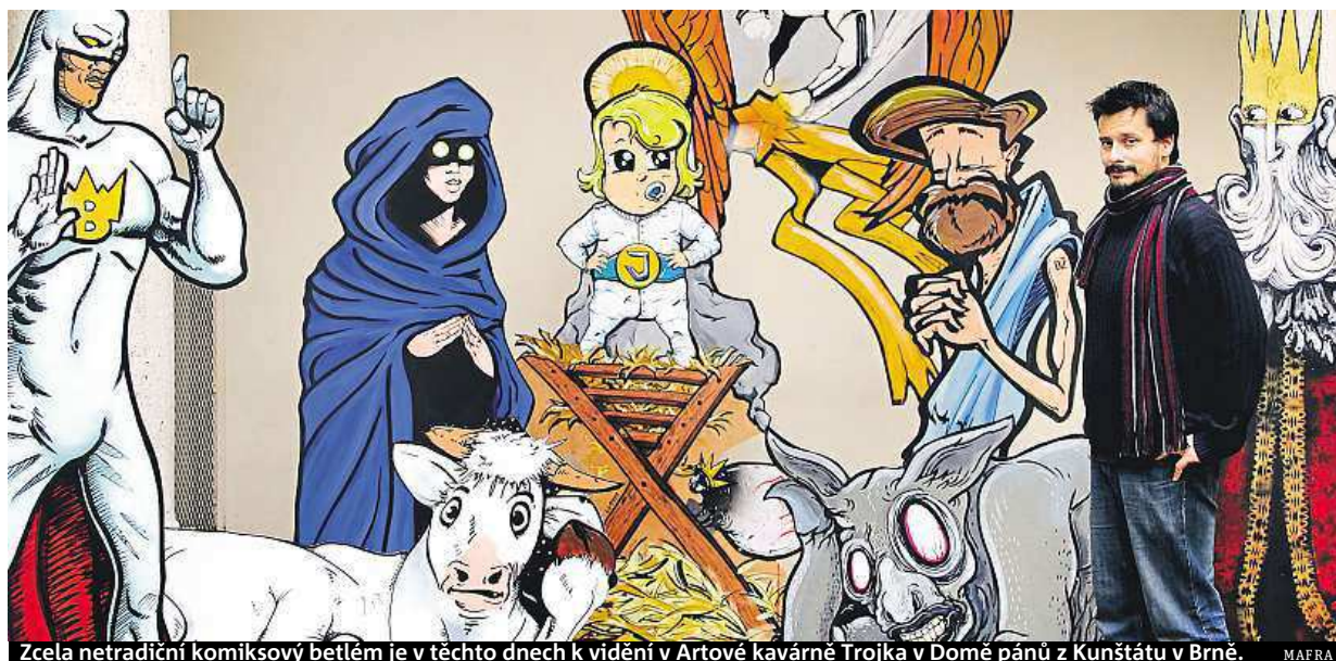
Zcela netradiční komiksový betlém je v těchto dnech k vidění v Artové kavárně Trojka v Domě pánů z Kunštátu v Brně. MAFRA

Konec roku. Doma, v restauraci, na horách nebo v zahraničí. U televize. Doma vítají nový rok nejčastěji lidé starší 27 let. Výdaje na silvestra. Jsou skromnější, mnohé z nás finančně vyčerpají vánoční dárky STRANA 2