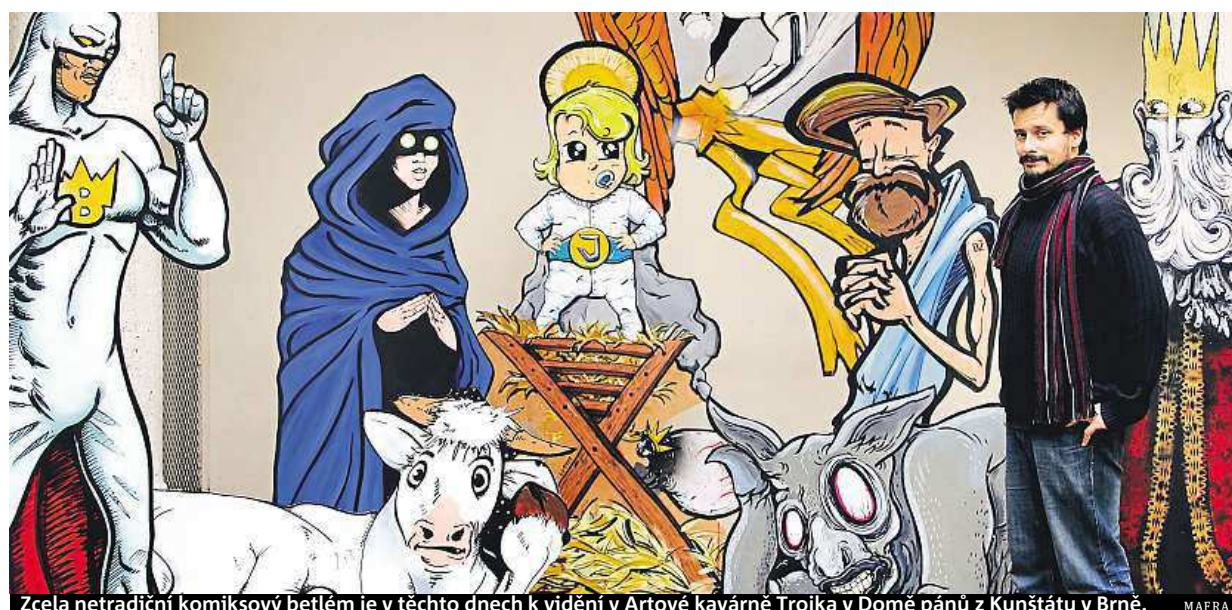
Zcela netradiční komiksový betlém je v těchto dnech k vidění v Artové kavárně Trojka v Domě pánů z Kunštátu v Brně.

Konec roku. Doma, v restauraci, na horách nebo v zahraničí. U televize. Doma vítají nový rok nejčastěji lidé starší 27 let. Výdaje na silvestra. Jsou skromnější, mnohé z nás finančně vyčerpají vánoční dárky STRANA 2