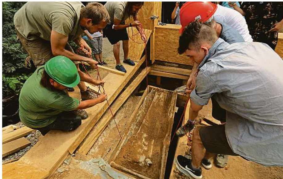
Mendelova rakev ležela dva a půl metru pod zemí.

V rakvi se našly kromě kostí také boty, oděv, vzácné kříže, ale například i noviny z roku 1883. Antropologická měření také odhalila třeba výšku Mendelovy postavy nebo velikost bot. K získání