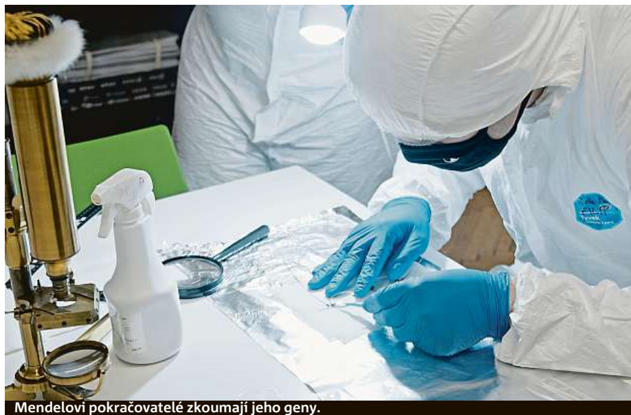
Mendelovi pokračovatelé zkoumají jeho geny.