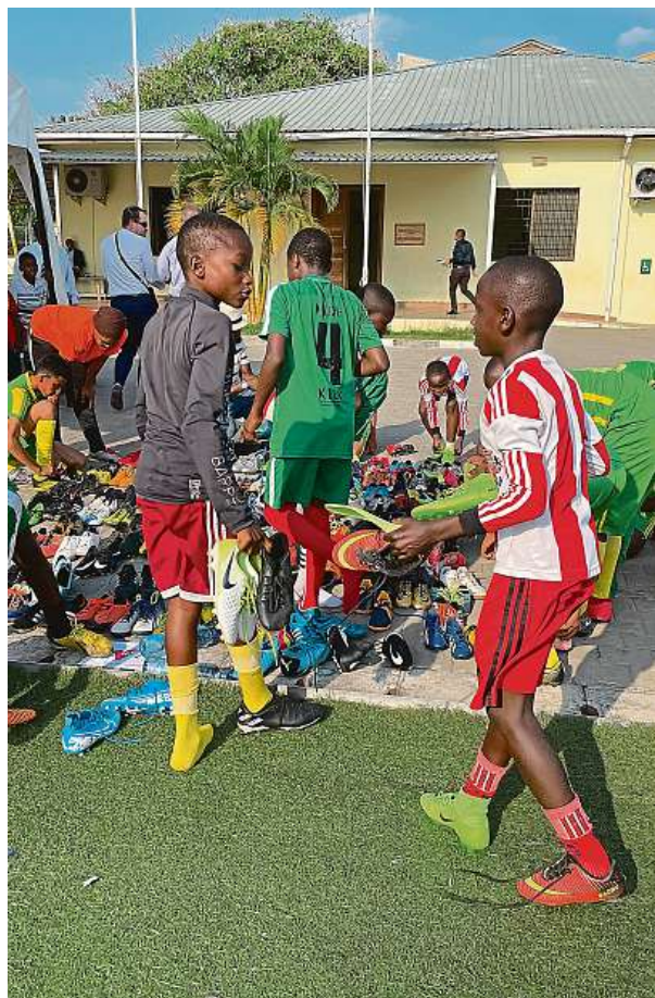
Kopačky mladých fotbalistů našly majitele.

„Už teď máme přes dvě stě dalších párů kopaček, ale také balony a dresy, které bychom v případě zájmu rádi předali dalším fotbalovým klubům v Tanzanii,“ upřesňuje Havlík. Zároveň chce Mladý Zbrojovák poskytnout talentovaným tanzanským fotbalistům možnost zúčastnit se jejich tréninkových kempů. RADEK BABIČKA