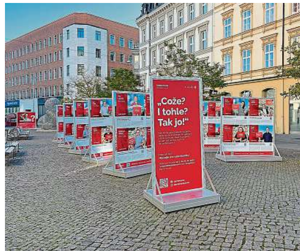
Výstava projektů probíhá na Malinovského náměstí. MMB

Uspěť by však v participativním rozpočtu mohlo podle průběžných výsledků přibliž-