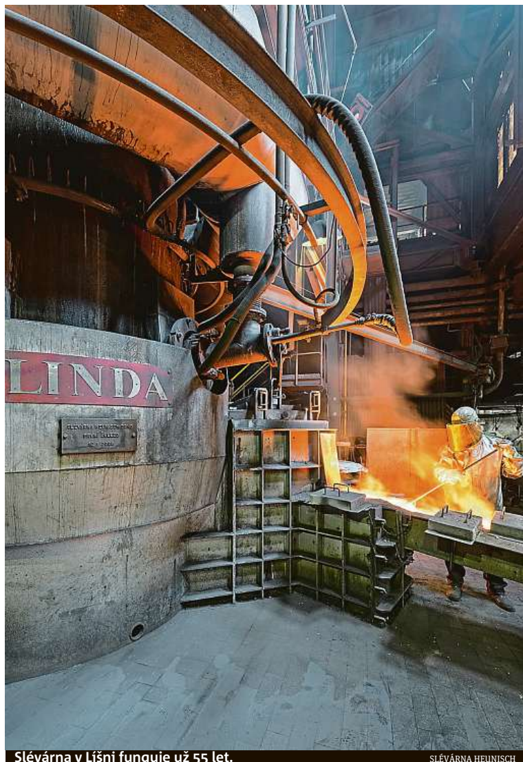
Slévárna v Líšni funguje už 55 let.

Lohmann & Rauscher, s.r.o., Bučovická 256, 684 01 Slavkov u Brna.