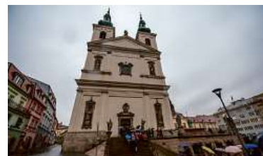
Komentovaná prohlídka Kláštery v centru Brna

Spirituální centra města, kterými byly již od středověku kláštery a rádoové komunity, poznáme na adventní prohlídce Kláštery v centru Brna . Duchovní rozměr má i vánoční procházka Brněnské betlémy , na které se seznámíme s historií betlémů v Brně i ve světě. S dětmi si užijeme řadu zábavných aktivit a her, když otevřeme dopis Ježíškovi a zjistíme Co by chtěl drak pod stromeček? A pokud brněnského draka děti ještě neznají, mohou jej a spoustu dalších pověstí poznat na procházce Brněnské pověsti pro děti . Pro ty zimomřivější z nás vyjede během adventu na svou trasu vyhlíd-