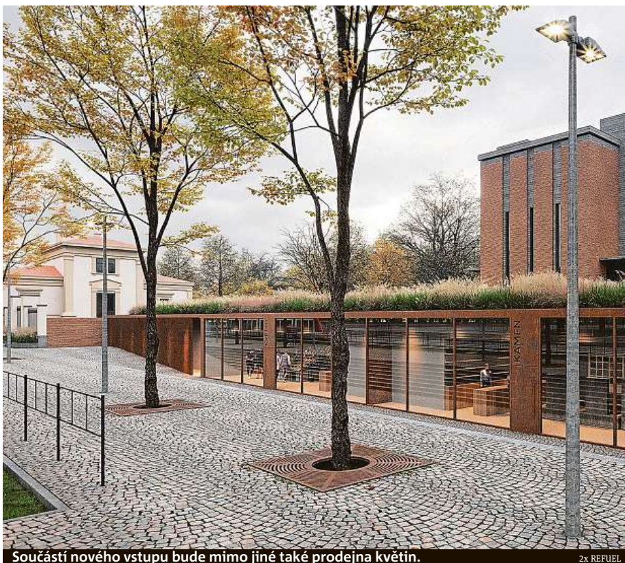
Součástí nového vstupu bude mimo jiné také prodejna květin.