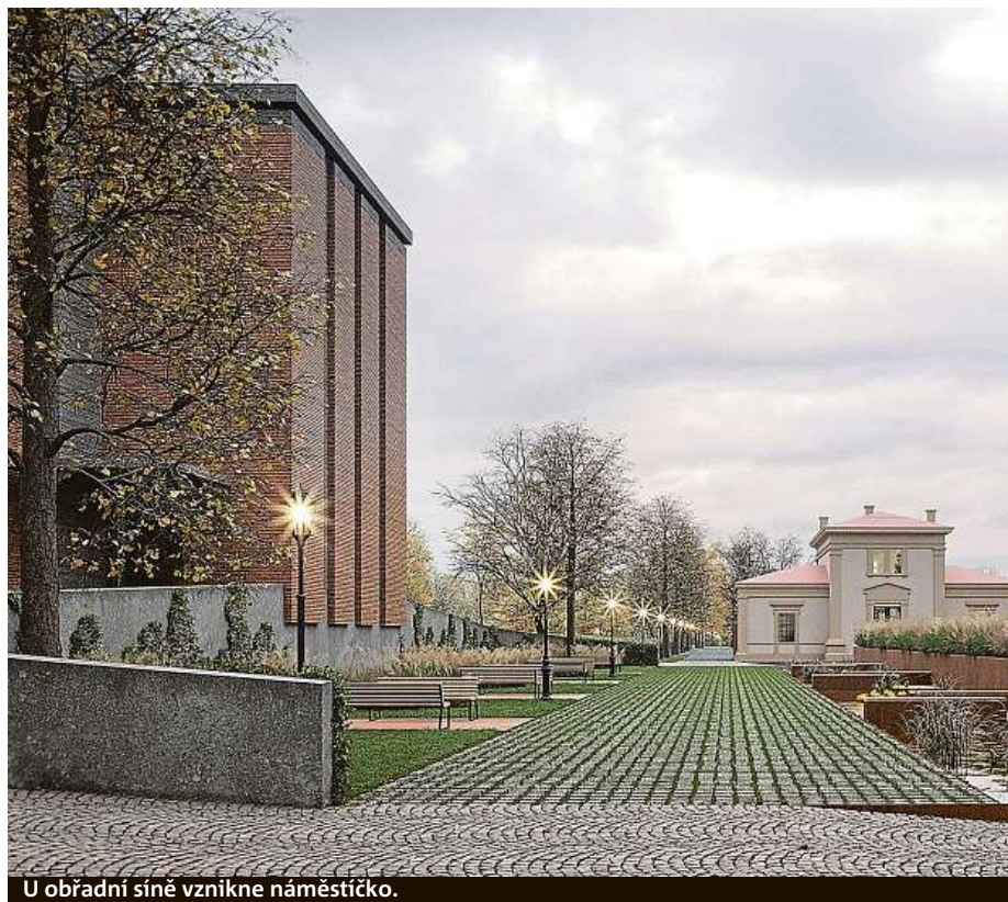
U obřadní síně vznikne náměstíčko.

Vítězný návrh zaujal především kultivovaností a citlivostí ve vztahu ke stávající kompozici.