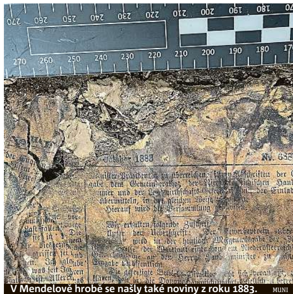
V Mendelově hrobě se našly také noviny z roku 1883.