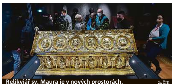
Relikviář sv. Maura je v nových prostorách.

rok. „V Čechách je vitrína jediná svého druhu. Je ojedinělá nejenom svojí bezpečností, ale i novými řízeními světla a klimatizací. Díky její bez-