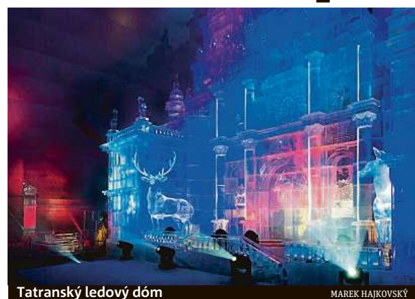
Tatranský ledový dóm