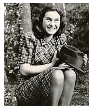
H. Kleinová ARCHIV F. FRIŠTENSKÉHO