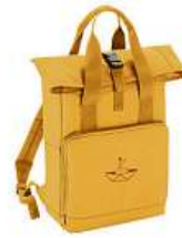
Batoh Sestry Geislerovy 850 Kč

Kompletní nabídku naleznete na www.klokart.cz klokart klokart