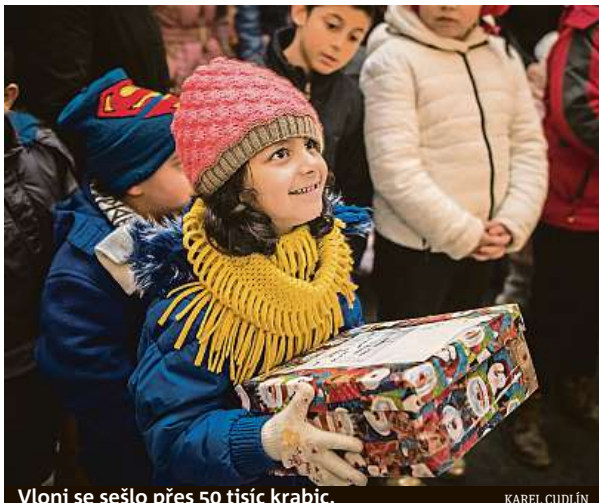
Vloni se sešlo přes 50 tisíc krabic.

„V Česku je aktuálně téměř 250 tisíc dětí ohrožených chudobou, v prohlubující se pandemické, bytové a energetické krizi bude rodin potřebujících pomoc přibývat. Je proto dobře, že z počáteční aktivity několika odhodlaných dobrovolníků vyrostla během deseti let největší vánoční sbírka v České republice, do které se zapojuje stále více rodin, škol, organizací i firem,“ říká Zdeňka Sobotová, manažer-