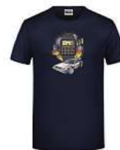
Tričko Návrat do budoucnosti 650 Kč