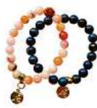
Náramek Bára Poláková 350 Kč