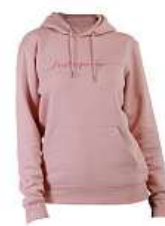
Mikina Vlastina Svátková 1 550 Kč