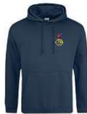
Unisex mikina Dan Bárta 950 Kč