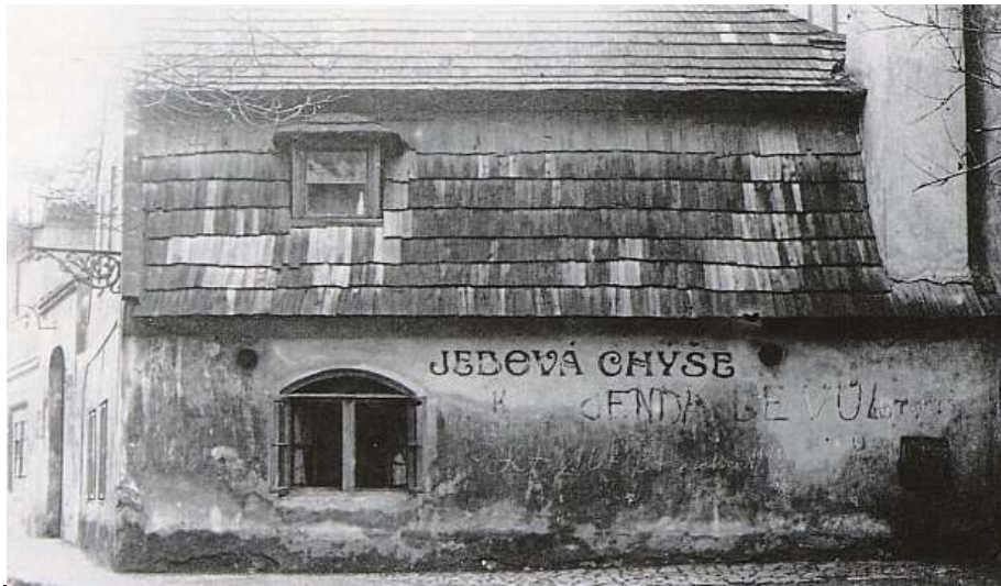
Jedová chýše v roce 1920

Jedna z nich dokonce tvrdí, že hospodu navštívil také sám král Václav IV. Ten sem