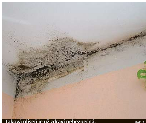
Taková plíseň je už zdraví nebezpečná.

Projevy alergie na plísně jsou podobné jako u jiných alergií, ale zpravidla se jedná o rýmu, zánět očních spojivek, ekzém, chronický kašel či astma, bolest hlavy. To, zda