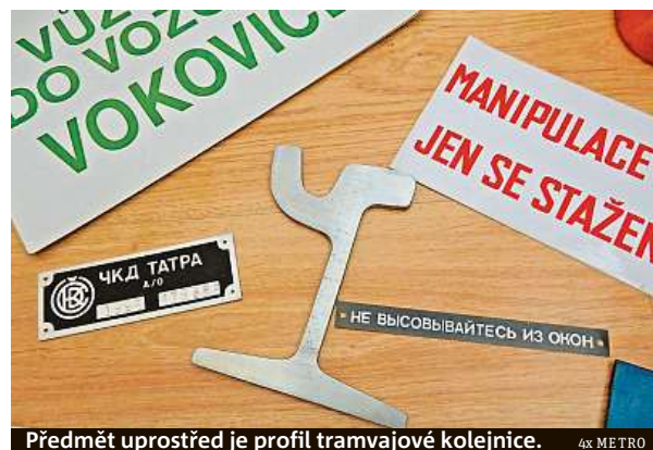
Předmět uprostřed je profil tramvajové kolejnice.