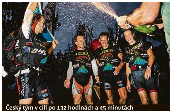
Český tým v cíli po 132 hodinách a 45 minutách