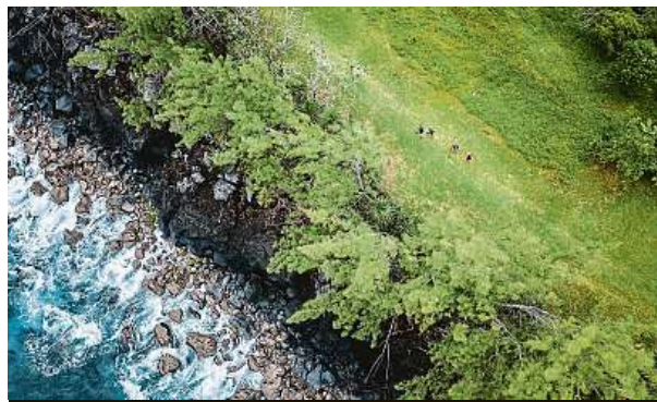
Kousek od vod Indického oceánu