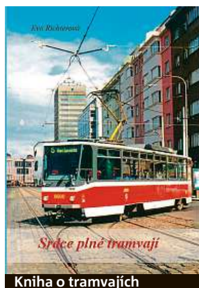
Knihy o tramvajích