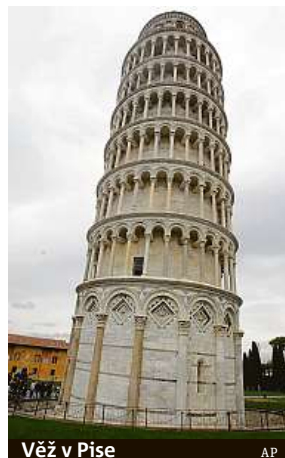
Věž v Pise

Profesor na univerzitě v Pise Nunzianta Squeglia uvedl, že odklon věže vysoké 54,4 metru od svislé osy se snížil o čtyři centimetry. Odklon je nyní o půl stupně menší než na přelomu tisící-