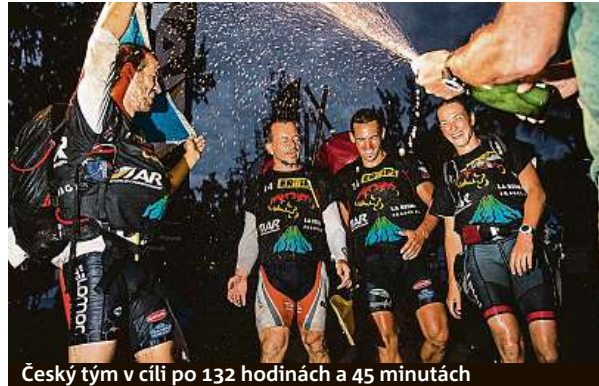
Český tým v cíli po 132 hodinách a 45 minutách