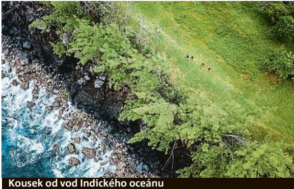
Kousek od vod Indického oceánu