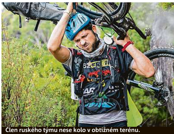
Člen ruského týmu nese kolo v obtížném terénu.