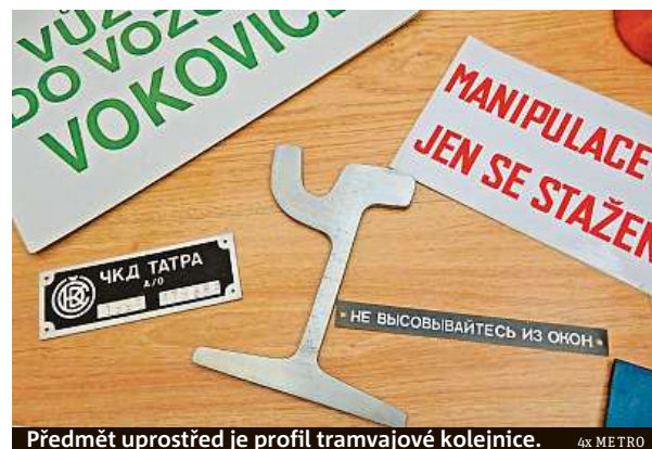
Předmět uprostřed je profil tramvajové kolejnice.