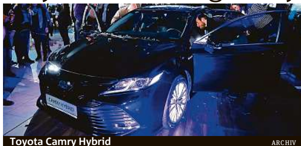
Toyota Camry Hybrid

Osmá generace celosvětově populárního sedanu postavená na zcela nové platformě TNGA nabídne nejmodernější technologie a vyspělé systémy aktivní bezpečnosti. Novinku bude pohánět hybridní