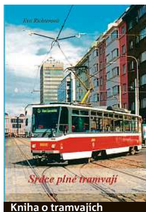
Kniha o tramvajích