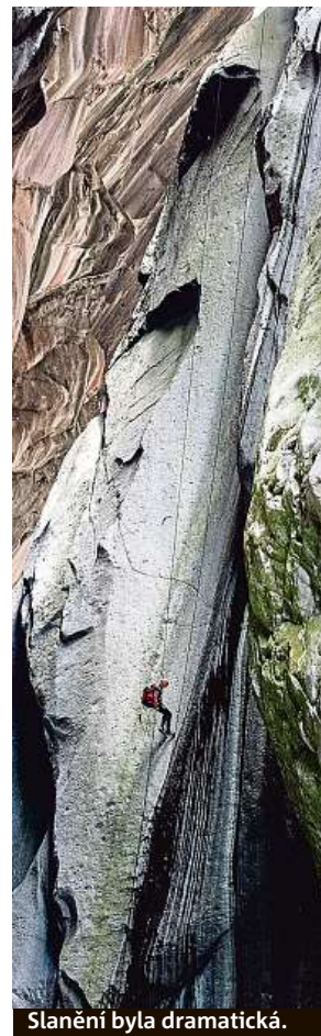
Slánění byla dramatická.

Jediný odpočinek je spánek. Tělo usíná okamžitě a kdekoliv. Za pět a půl dne závodu jsme naspali 14 hodin. To je docela hodně, obvykle spíme méně. U tohoto závodu byla povinnost nespát v součtu minimálně 12 hodin. Zbývající dvě hodiny jsme spali mimo depo na prvním treku, když mi nebylo úplně dobře a musel jsem se dostat z počínajícího úžehu. Tělo při takovém závodě velmi strádá. Než se pak vrátí zpět, trvá to často i měsíc.