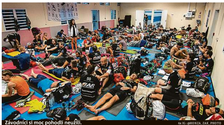
Závodníci si moc pohodlí neužili.