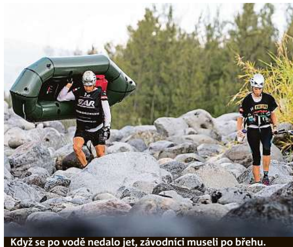
Když se po vodě nedalo jet, závodníci museli po břehu.

S sebou dostaneme pouze několik setů voděodolných map, které nám stačí na celý závod. V nich jsou zaznačeny jednotlivé kontrolní body, kterými musíme projít, jsou tam třeba zakázané silnice apod. Součástí navigace je