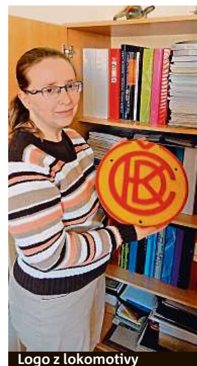
Logo z lokomotivy