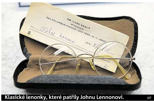
Klasické lenonky, které patřily Johnu Lennonovi.

Osmapadesátiletý Němec tureckého původu dispono-