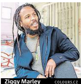
Ziggy Marley

Osminásobný držitel Grammy Ziggy Marley vystoupí příští rok v Ostravě.