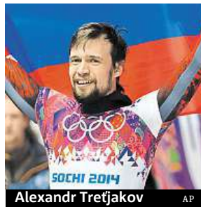
Alexandr Treťjakov

Olympijský vítěz ze Soči Alexandr Treťjakov je jedním ze čtyř ruských skeletonistů, které včera Mezinárodní olympijský výbor potrestal v souvislosti s dopingovým skandálem Rusů na hrách v roce 2014 doživotním vyloučením z OH. Po diskvalifikaci bude muset vrátit cenný kov stejně jako bronzová medailistka ze závodu žen Jelena Nikitinová.