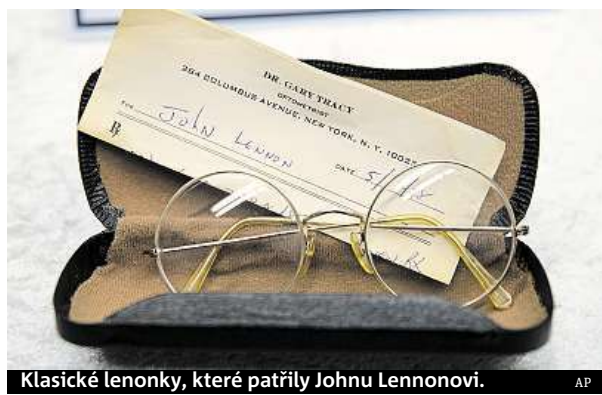
Klasické lenonky, které patřily Johnu Lennonovi.

Osmapadesátiletý Němec tureckého původu dispono-