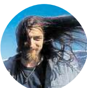
Petr Karásek Zeman Je gentleman?