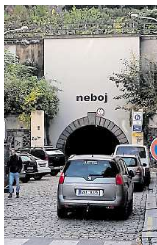
ZK RADEK BABIČKA