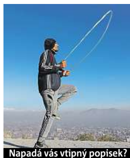
Napadá vás vtipný popisek?

Napište bublinu a reagujte na sloupek na: www.facebook.com/denikmetro