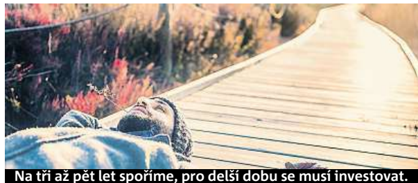
Na tři až pět let spoříme, pro delší dobu se musí investovat.

Před deseti lety nastavil trvalý příkaz, dnes má 435 tisíc korun.