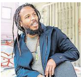
Ziggy Marley

Osminásobný držitel Grammy Ziggy Marley vystoupí příští rok v Ostravě.