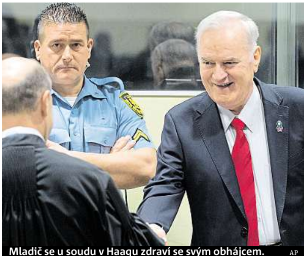
Mladić se u soudu v Haagu zdraví se svým obhájcem.

Bývalého velitele bosensko-srbské armády poté poslal do vězení na doživotí za zločiny spáchané během války v Bosně a Hercegovině v letech 1992 až 1995. Uznal ho přitom vinným v deseti z jedenácti bodů obžaloby. Předpokládá se, že Mladič využije možnosti odvolání.