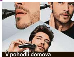
V pohodlí domova

Ještě než se do toho dáte, měli byste promyslet náš dnešní úlovek – skvělou sadu