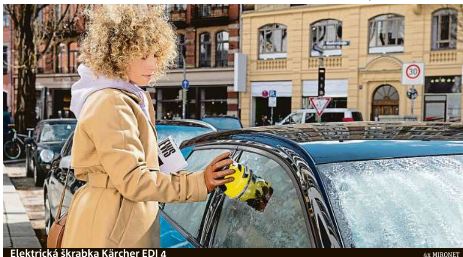
Elektrická škrabka Kärcher EDI 4

Jistěže, vaše prošlá kreditní karta je pro tuto chvíli připravena ve vaší peněžence a není třeba nijak se znervózňovat. To si řekne kdekdo, dokud se mu karta nezlomí vejpůl a bude marně pátrat po dalším expirovaném průkazu. Pokud na tuto situaci chcete být připraveni a nechcete se zbytečně namáhat ani se škrabkou, která sice slouží k této činnosti, ale všichni dobře víme, jak to potom vypadá, doporučíme vám naši dnešní hvězdu večera – elektrickou škrabku Kärcher EDI 4. Pomocí rotující-