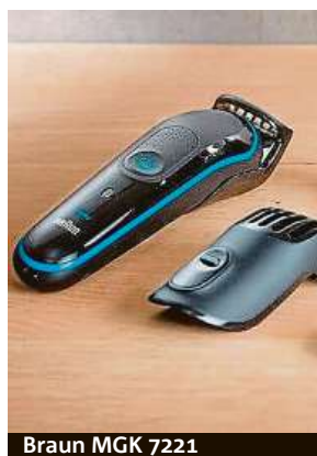
Braun MGK 7221

kolik použití. Vestavěná LED kontrolka bliká, pokud je třeba zařízení nabít. Elektrickou škrabku Kärcher EDI 4 doporučujeme zakoupit v internetovém obchodě Mironet, kde ji najdete za skvělou cenu pouhých 1290 korun.