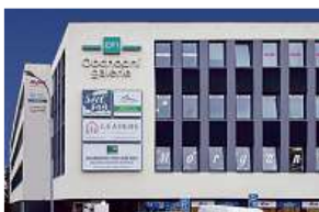
Obchodní galerie, Jihlava