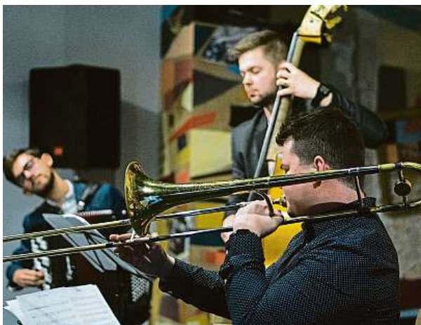
Mladí hudebníci měli v bulharské Sofii velký úspěch.

Treetop během čtyřdenního turné zahrálo na začátku října ve čtyřech městech: So-