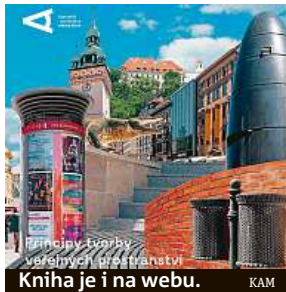
Kniha je i na webu.

Kniha se rodila téměř tři roky a pracoval na ní tým deseti autorů a více jak dvaceti spolupracovníků. Ukazuje velké množství dobrých i špatných příkladů veřejných prostranství, a to pomocí fotografií a diagramů s do-