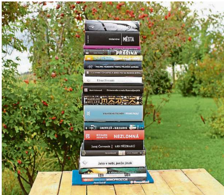
Veškeré informace o knihách i autorech najdete na stránce www.velkyctvrtek.cz .