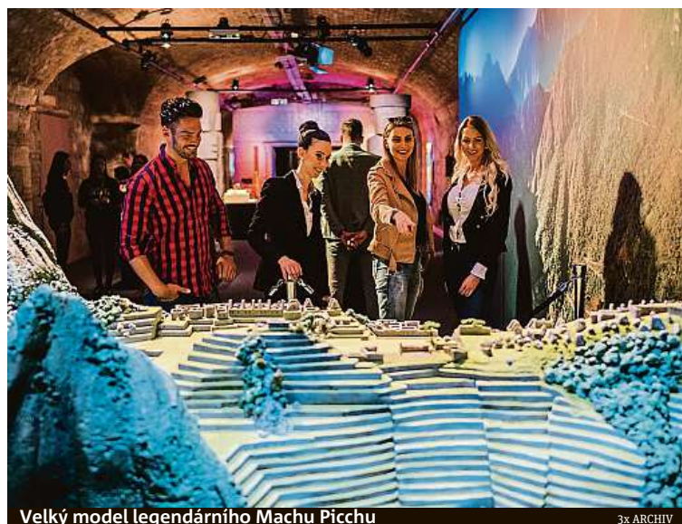
Velký model legendárního Machu Picchu