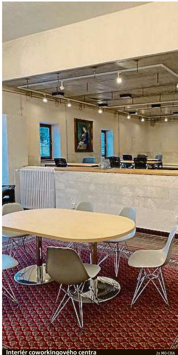
Interiér coworkingového centra

Provozovatelé věří, že se jejich prostory stanou útočištěm i pro účastníky brněnských veletrhů. Kromě komfortního prostředí pro práci mají v plánu nabídnout kulturní program či pořádání společenských akcí. „V rámci akcí máme do konce roku vedle klasických firemních večírků naplánované i školení na osobní rozvoj, přednášky o využití sociálních sítí jako marketingových nástrojů, komentované promítání fotografií ze zajímavých světových destinací nebo populární vědomostní kvízy s tematickým zaměřením,“ říká Kůlová. Aktuální termíny akcí zveřejňují provozovatelé na webových stránkách mo-cha.cz a na sociálních sítích. RADEK BABIČKA