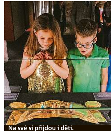
Na své si přijdou i děti.

Poklad Inků bude k vidění od začátku listopadu do konce ledna příštího roku. Více informací najdou zájemci na webu pokladinku.cz . RADEK BABIČKA