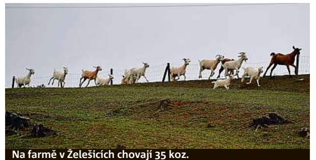
Na farmě v Želešicích chovají 35 koz.