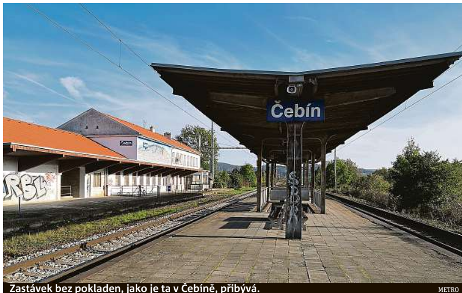
Zastávek bez pokladen, jako je ta v Čebíně, přibývá.

Vlakové soupravy na jihomoravských linkách budou nově opatřeny vozem se zeleným pruhem pod střechou a nápisem Jízdenky Info Tickets. V tomto voze se bude průvodčí převážně zdržovat a zajišťovat prodej jízdních dokladů. Opatření zavádí kraj s cílem snížit počet černých pasažérů. Dosud totiž někteří lidé schválně nastupovali do