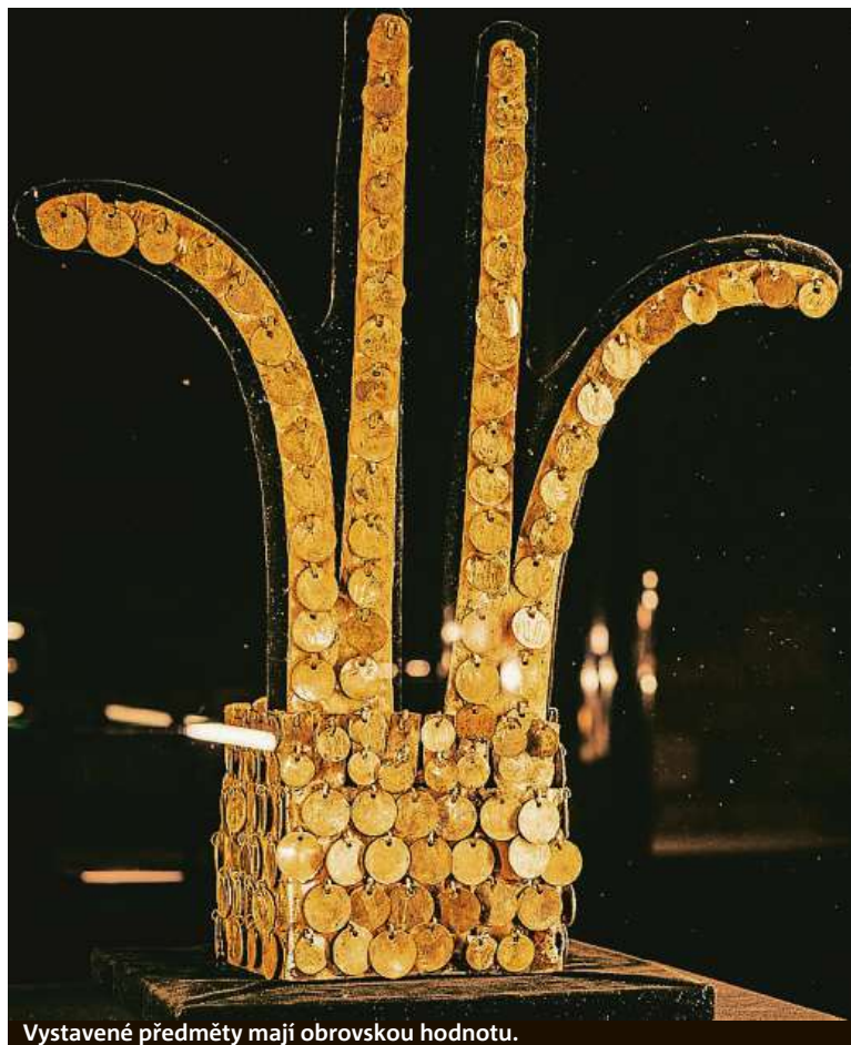
Vystavené předměty mají obrovskou hodnotu.