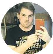
Tom Ekan Derka Svatý Václav musí rotovat v hrobě, co jsme dovolili...