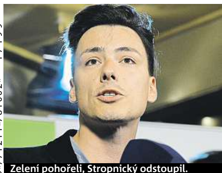
Zelení pohořeli, Stropnický odstoupil.