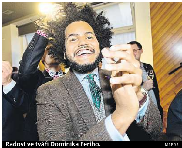
Radost ve tváři Dominika Feriho.