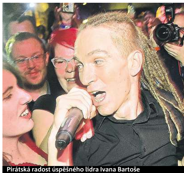
Pirátská radost úspěšného lídra Ivana Bartoše