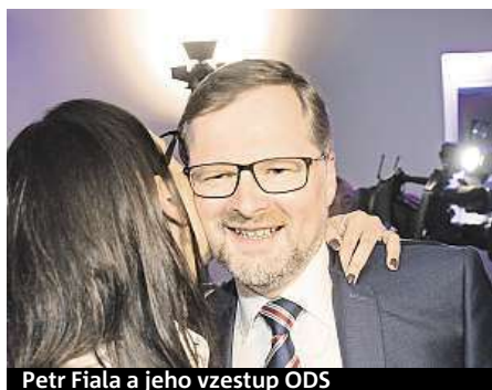
Petr Fiala a jeho vzestup ODS