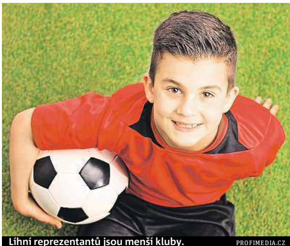
Líhní reprezentantů jsou menší kluby.