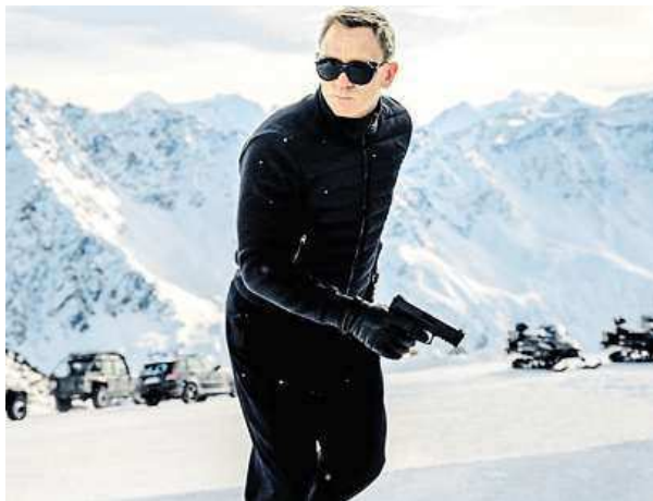
Nová bondovka Spectre s Danielem Craigem

Mezi šestým a patnáctým listopadem tak bude zájemcům k dispozici sedmáct filmů s nejslavnějším britským špiónem.