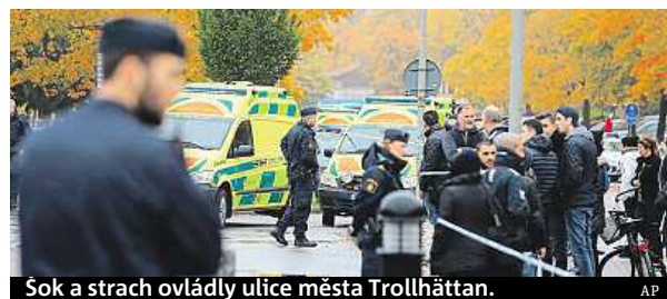
Šok a strach ovládly ulice města Trollhättan.

Motiv činu není znám. Podle policie na školu zaútočil včera kolem desáté hodiny dopolední muž ve věku 20 až 30 let. Zranění studenti ve věku 11 a 15 let utrpěli bodné rány do břicha a hrudi