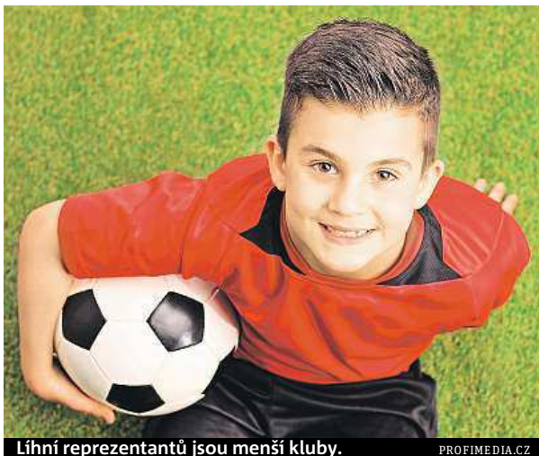
Líhní reprezentantů jsou menší kluby.