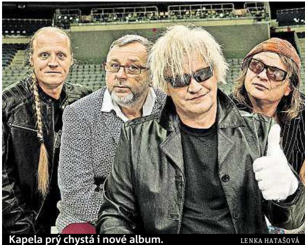
Kapela prý chystá i nové album.