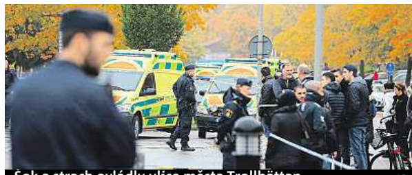
Šok a strach ovládly ulice města Trollhättan.

Motiv činu není znám. Podle policie na školu zaútočil včera kolem desáté hodiny dopolední muž ve věku 20 až 30 let. Zranění studenti ve věku 11 a 15 let utrpěli bodné rány do břicha a hrudi