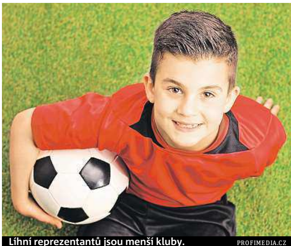
Líhni reprezentantů jsou menší kluby.