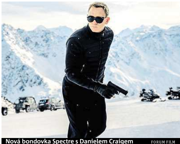
Nová bondovka Spectre s Danielem Craigem

Mezi šestým a patnáctým listopadem tak bude zájemcům k dispozici sedmáct filmů s nejslavnějším britským špiónem.