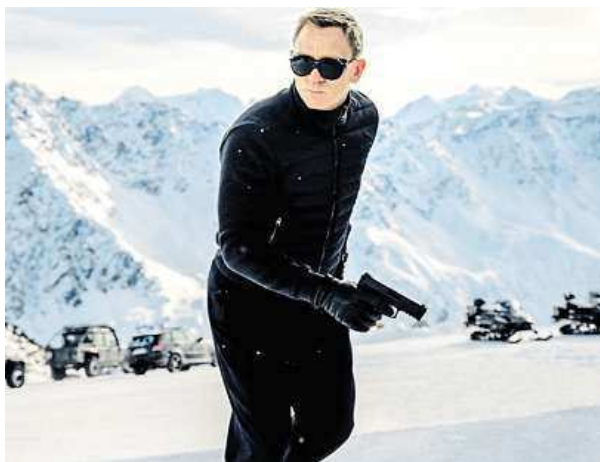
Nová bondovka Spectre s Danielem Craigem

Mezi šestým a patnáctým listopadem tak bude zájemcům k dispozici sedmáct filmů s nejslavnějším britským špiónem.