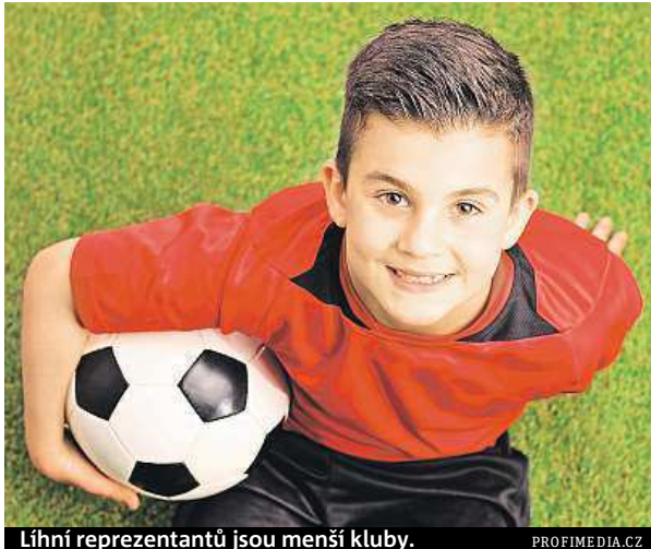
Líhní reprezentantů jsou menší kluby.