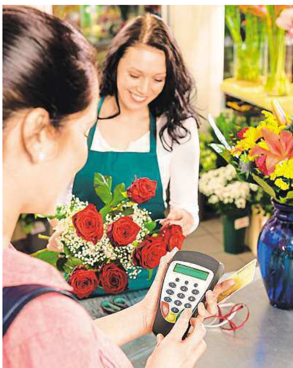
Platit kartou je možné i bez zadávání PIN.

Právě na placení prostřednictvím mobilních telefonů se nyní vydavatelé platebních karet zaměřují. „Víme, že budoucnost je především v mobilním placení, proto se soustředíme na nové techno-