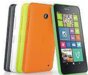
Značka Nokia končí. NOKIA

Společnost Microsoft v dubnu dokončil převzetí divize pro výrobu mobilů od finské společnosti Nokia. Za divizi zaplatil 5,44 miliardy eur (přes 150 miliard korun). ČTK