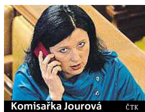
Komisařka Jourová

Evropský parlament včera schválil novou Evropskou komisi v čele s předsedou Jeanem-Claudem Junckerem. Součástí sboru eurokomisařů je i česká exministryně Věra Jourová. Osmadvacet členů „unijní vlády“ se ujme funkce 1. listopadu.