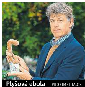
Plyšová ebola

deji je jich přes sto padesát druhů standardní nebo „obří“ velikosti. ČTK