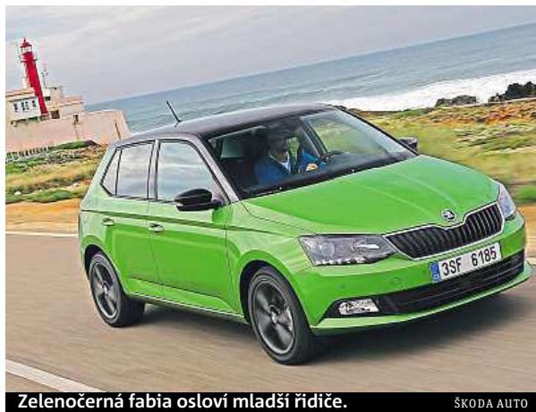
Zelenočerná fabia osloví mladší řidiče.

Čtyřválcové benzinové turbomotory vyhoví mladším zájemcům o svižnou jízdu na delších i krátkých trasách. Fabia 1.2 TSI ve výkonových verzích 66 a 81 kW pěkně táhne ve všech otáčkách a ani vyloženě sportovní jízda nezvyšuje spotřebu do hrozivých čísel. S příplatkovými šestnáctipalcovými koly se auto drží silnice lépe než většina ostatních malých hatchbacků, a přitom zůstává příjemně komfortní.