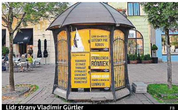
Lídr strany Vladimír Gürtler