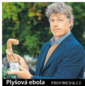
Plyšová ebola PROFIMEDIA.CZ

deji je jich přes sto padesát druhů standardní nebo „obří“ velikosti. ČTK