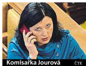
Komisařka Jourová

Evropský parlament včera schválil novou Evropskou komisi v čele s předsedou Jeanem-Claudem Junckerem. Součástí sboru eurokomisařů je i česká exministryně Věra Jourová. Osmadvacet členů „unijní vlády“ se ujme funkce 1. listopadu.