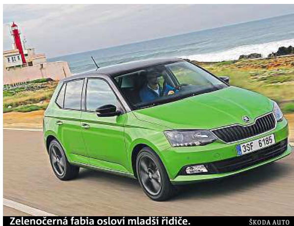
Zelenočerná fabia osloví mladší řidiče.

Čtyřválcové benzinové turbomotory vyhoví mladším zájemcům o svižnou jízdu na delších i krátkých trasách. Fabia 1.2 TSI ve výkonových verzích 66 a 81 kW pěkně táhne ve všech otáčkách a ani vyloženě sportovní jízda nezvyšuje spotřebu do hrozivých čísel. S příplatkovými šestnáctipalcovými koly se auto drží silnice lépe než většina ostatních malých hatchbacků, a přitom zůstává příjemně komfortní.