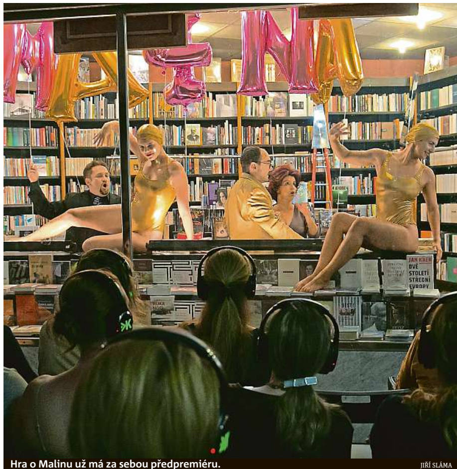
Hra o Malinu už má za sebou předpremiéru.