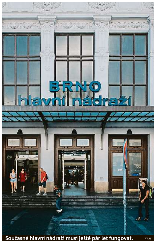
Současné hlavní nádraží musí ještě pár let fungovat. KAM

Hodnocení rozpracovaných dvanácti vybraných návrhů proběhne v únoru, ze čtyř nejlepších porota vybere po dalším rozpracování absolutního vítěze v červnu příštího roku. Správa železnic a město Brno chtějí s vítězným týmem soutěže uzavřít smlouvu na zhotovení architektonické studie včetně autorského dohledu a navazujících činností. KAM odhaduje, že nové nádraží, které bude u řeky místo dolního nádraží, by mohlo být hotové za deset let. RADEK BABIČKA