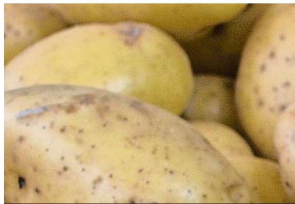
Brambory pěstovali na 1500 hektarech.

V Zoší Agro na Brněnsku mají letos okurek zhruba stejně jako loni. Přesto zdražovaly o několik korun. „Kvůli koronaviru nám chyběli lidé,