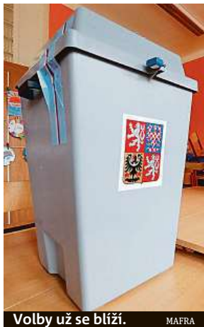
Volby už se blíží.