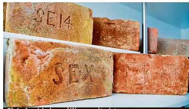
Zřejmě nejsledovanější exponát výstavy