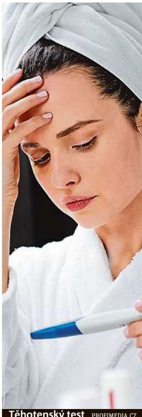
Těhotenský test

Nemáme dostatečné znalosti o vlastní plodnosti a jsme ovlivněni dezinformacemi na internetu.