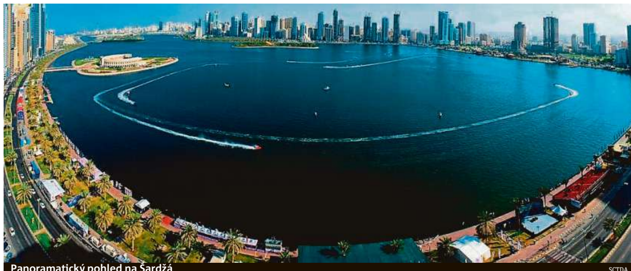
Panoramatický pohled na Šardžá