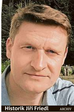
Historik Jiří Friedl ARCHIV

Polsko-sovětská válka z let 1919-1921 byl primárně boj o polskou východní hranici.