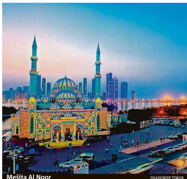
Mešita Al Noor