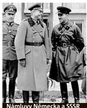
Náměly Německa a SSSR

mi vztahy v souvislosti s historickými okolnostmi.