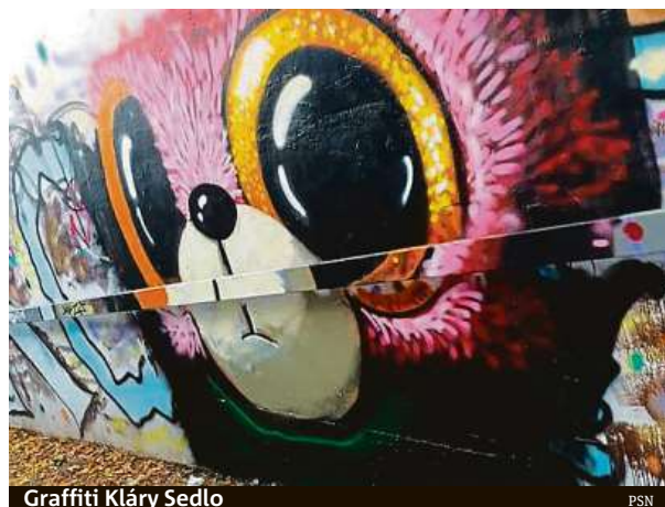
Graffiti Kláry Sedlo

„Tento projekt je pro mě zajímavou adrenalinovou výzvou a splněným snem. Má malba a celkově tvorba je považována za dynamickou a výbušnou, což mi přijde příhodné právě pro architekturu Tančícího domu,“ říká Lucie Jindrák Skřivánková. MET