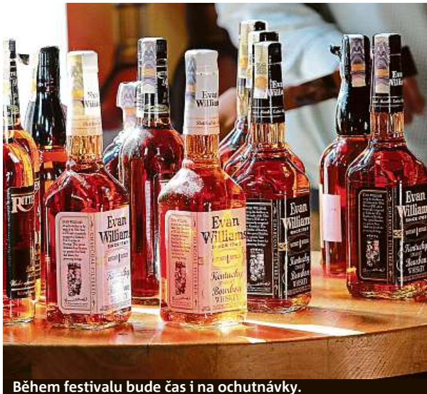
Během festivalu bude čas i na ochutnávky.

Součástí festivalu bude živá hudba, skotské dudy, kility, doutníky, tombola, jídlo. Nezapomeňte, kdo přijde ve