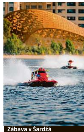
Zábava v Šardžá

zít na výlety do hor, vyjet terénním vozem do pouštních dun i pádlovat na kajaku mangovníkovými porosty podél pobřeží. Také tam můžete vyzkoušet paragliding, golf či jízdu na kole nebo na koni. LUCIE MOTTLOVÁ