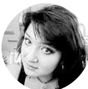
Eva Glainne Zvědavá jsem, ale do kina se mi na to nechce.

Do kin míří nová verze Sedmi statečných. Vyzrazíte?