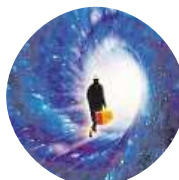
Little Prince Porovnávat to tam rozhodně nepůjdu, maximálně si to užít.

Komiks. Divadlo Spejbla a Hurvínka najdete na www.facebook.com/DivadloSH