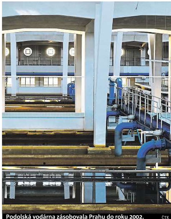
Podolská vodárna zásobovala Prahu do roku 2002.

Než začala vodárna dodávat vodu Pražanům, byla v několikaletém testovacím provozu. „Ladili jsme technologie, sledovali kvalitu vyrobené vody tak, aby splňovala všechny hygienické parametry pro pitnou vodu,“ uvedl Gandžala. Vodu bere vodárna z Vltavy, přitéká z jímacího objektu na Veslařském ostrově. Odtud se čerpá voda osmi čerpadly do vodárny. Odběr z řeky se na průtoky ve Vltavě podle Gandžaly nepozná. „Předpo-