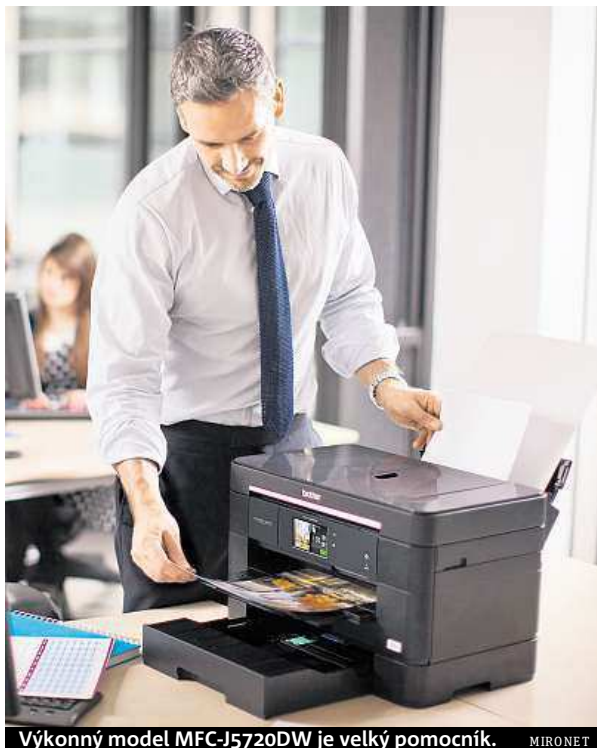
Výkonný model MFC-J5720DW je velký pomocník. MIRONET

Protože od společnosti Brother i internetového obchodu Mironet můžete očekávat vždy něco navíc, po krátké registraci produktu na webu výrobce obdržíte prodloužení záruky o další rok a od Mironetu se můžete těšit na pozornost v podobě špičkové 10 400mAh power banky.