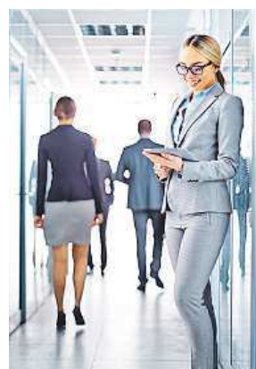
Řízená setkání

List The Guardian v článku nazvaném „Hra o trůny“ připomíná, že tuto myšlenku podporovali i technologičtí giganti jako Apple, jehož