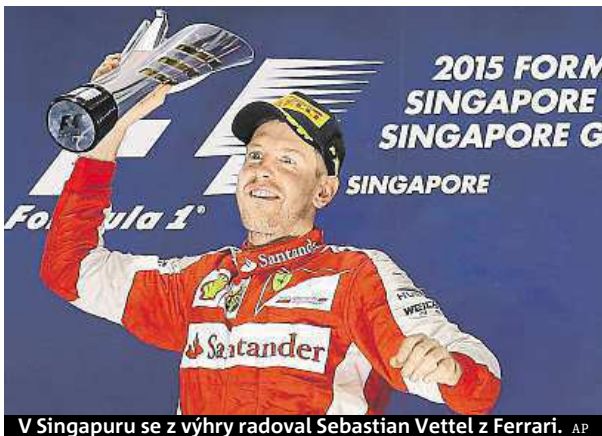
V Singapuru se z výhry radoval Sebastian Vettel z Ferrari.

Obviněn byl z bezohledného jednání, kterým ohrozil život jezdců. Hrozí mu až