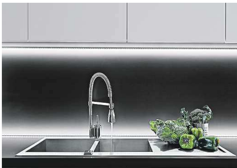
Jedna barva vládne všem... šedá je teď hodně v kurzu.