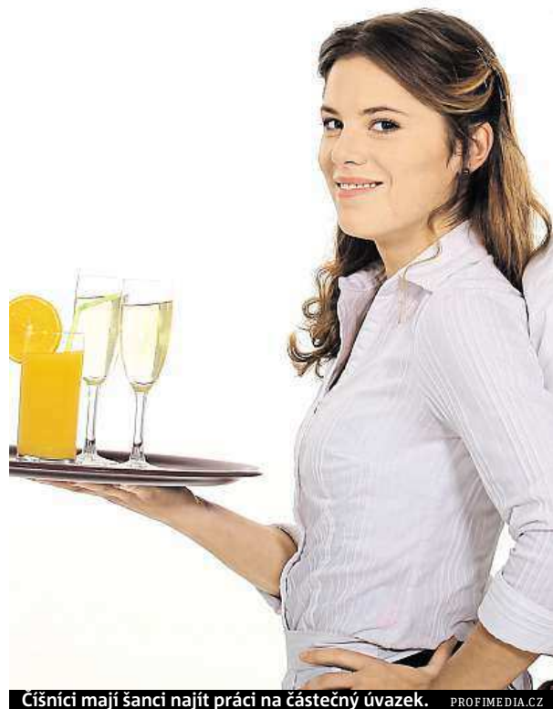
Číšníci mají šanci najít práci na částečný úvazek. PROFIMEDIA.CZ

Větší počet pracovních míst se zkráceným úvazkem se v tuzemsku snaží stát podporovat i formou bonifikace. „A to především v případě dlouhodobě nezaměstnaných či rodičů malých dětí, ale i dalších ohrožených skupin. Pokud zaměstnavatel přijme takového uchazeče na zkrácený pracovní úvazek, může to Úřad práce ČR zohlednit ve vyšší poskytnuté příspěvku,“ uzavírá Sadílková. METRO