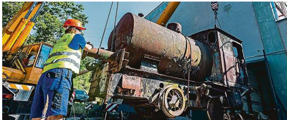
Jeřábničí nakládají ve Velkém Březně Schichtovu bezohňovou lokomotivu.