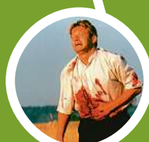
Promítání kultovního snímku Je třeba zabít Sekala 3x SOUNDTRACK