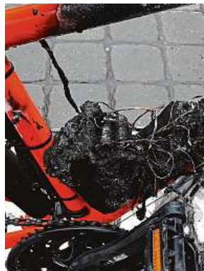
Baterie elektrokola se vznítla během jízdy.

V případě elektrovozů i dalších pohybovadel na baterie se jako výhoda zdůrazňuje, že se používají přes den a dobíjet je lze přes noc doma či v garáži. „Určitě je lepší nabí-