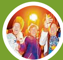
Koncert Tros Discoteqos