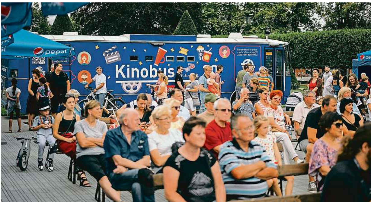
Během festivalu Soundtrack Poděbrady ožijí čilým ruchem. Promítá se po celém městě, návštěvníkům pomáhá mapka festivalu.