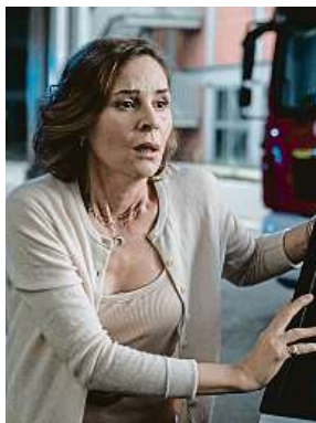
Embeth Davidtz je jednou z mála známých tváří snímku.

z roku 2015 El desconocido (Neznámý), na který po třech letech navázalo německé Ne-vystupuj! a za další tři roky verze jihokorejská. Je tedy snadné, že se scénář, v němž se v závislosti na zemi mění hlavní hrdina z bankéře na podnikatele či realitního makléře, těší oblibě mnoha filmařů. Podobná obliba není v aktuálním podání americko-španělsko-francouzsko-německé koprodukce alespoň u některých českých diváků