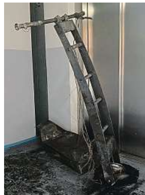
Požár od elektrokoloběžky v domě v pražské Libni