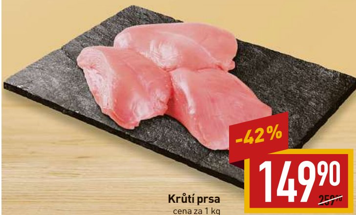
Krutí prsa cena za 1 kg