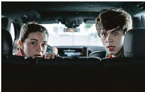
Bankovní byznysmen původně vezl děti autem do školy. Všichni ale ve filmu zažívají poněkud jinou bombovou jízdu.

thrillerové psychologii postav. Ta je však scenáristicky tak zjednodušeně nastíněna, že to snad ani víc nejde. Což je v přímém kontrastu s hereckými výkony nejen Neesona, ale i představitelů jeho dětí, kteří na svůj věk hrají, ehm, jako o život.