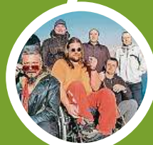
Koncert kapely Buty