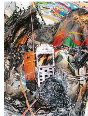
Totální zkáza bytu způsobil nabíječkou se mobilní telefon.

jet takové zařízení v době, kdy jste vzhůru a v případě, že se schyluje k poruše baterie či jejímu vznícení, můžete rychle reagovat,“ upozornil nedávno mluvčí pražských hasičů Martin Kavka.