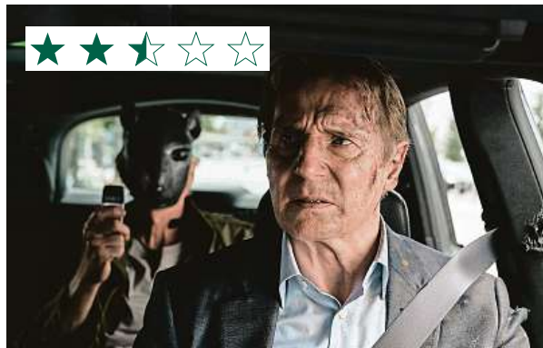
Matt Turner s tváří Liama Neesona je americký bankéř, který kariéru rozvíjí v Berlíně. Jednoho dne mu dají do auta bombu.

Snímek Jízda smrti oficiálně vstupuje do českých kin již zítra. Kvůli stávce herců a scenáristů se tak ale neděje