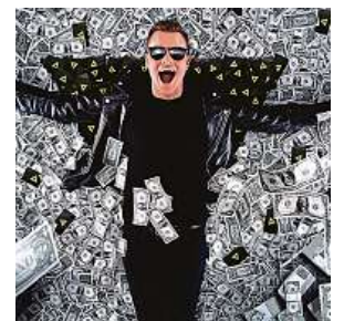
Nový snímek Onemanshow: The Movie láme rekordy. BONTON

vadním českým rekordmanem návštěvnosti byl film Anděl Páně 2, který během prvního víkendu vidělo 188 tisíc diváků. V podstatě jediným snímek, který Kazmovi v premiérovém víkendu odolal, je vrchol marvelovského tažení Avengers: Endgame, na který přišlo v prvních dnech 344 tisíc lidí. Kazma ale předběhl například první část filmu Harry Potter a relikvie smrti. TEREZA ŠIMURDOVÁ