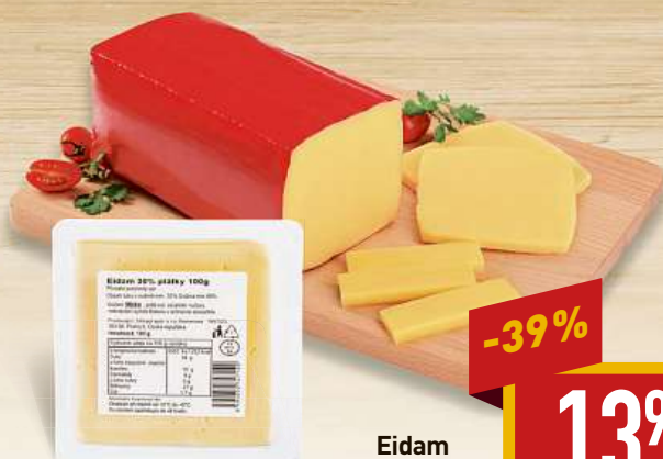
Eidam 30% plátky 100 g