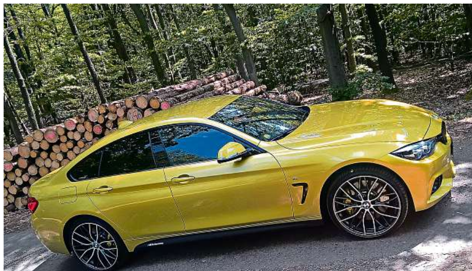
440i Gran Coupé má nízko položené těžiště a dokonalé rozložení hmotnosti.