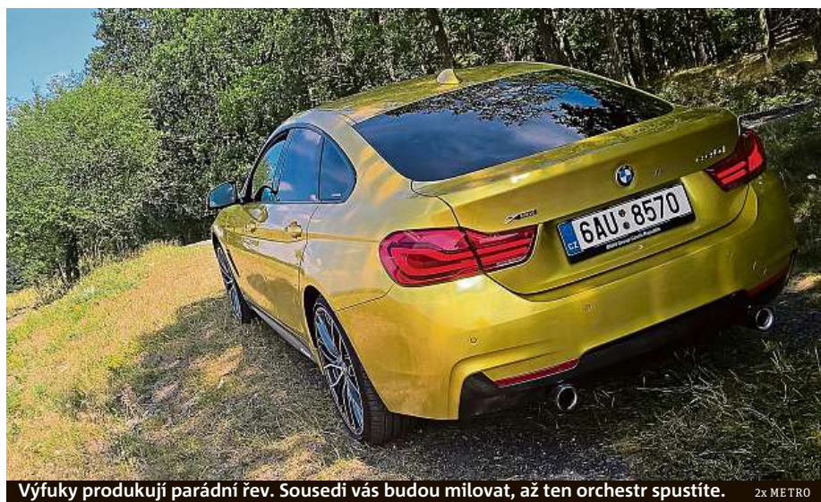
Výfuky produkují parádní rev. Sousedi vás budou milovat, až ten orchestr spustíte.