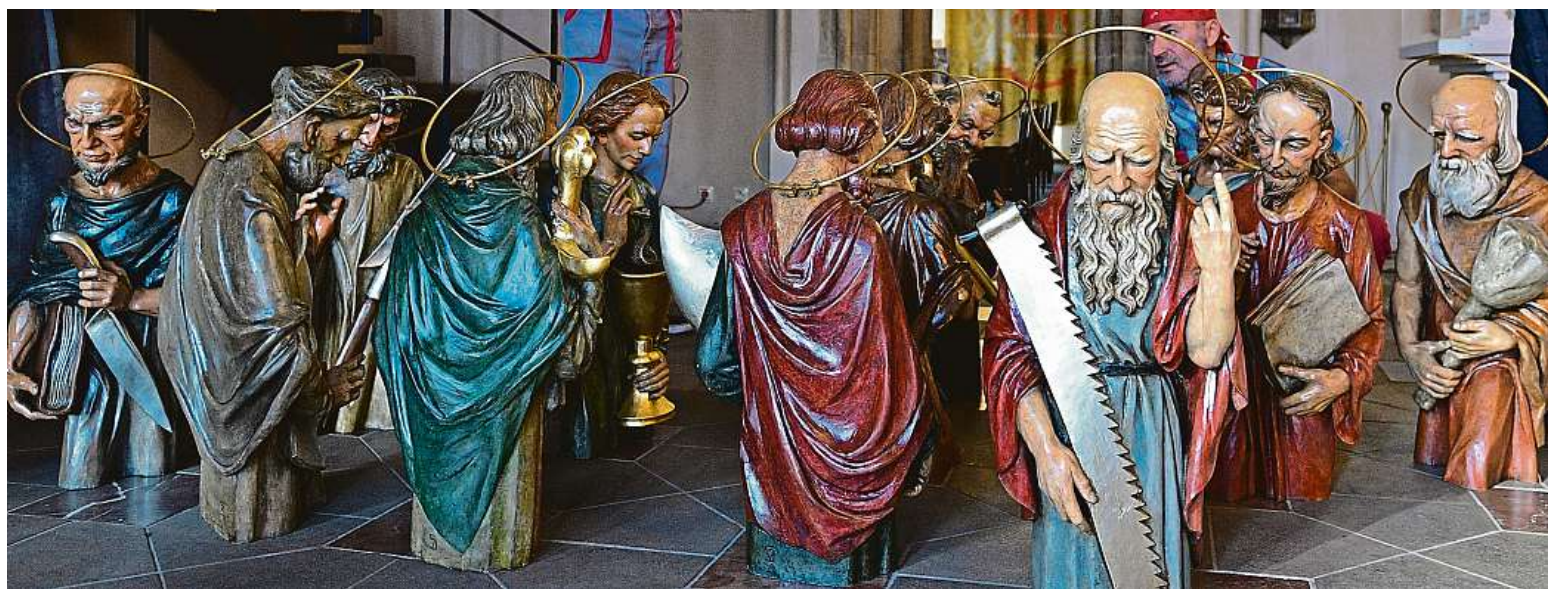
Do věže Staroměstské radnice v Praze se vrátili apoštolové. Kvůli opravám orloje byly sochy několik měsíců v restaurátorských dílnách.

Za volantem. Za jízdy nejen telefonujeme, ale také posíláme esemesky či sdílíme fotky na sociálních sítích. Sada handsfree. Používá ji jen polovina řidičů. Kampaň proti „mobilování“ v autě. Míjí se účinkem STRANA 2