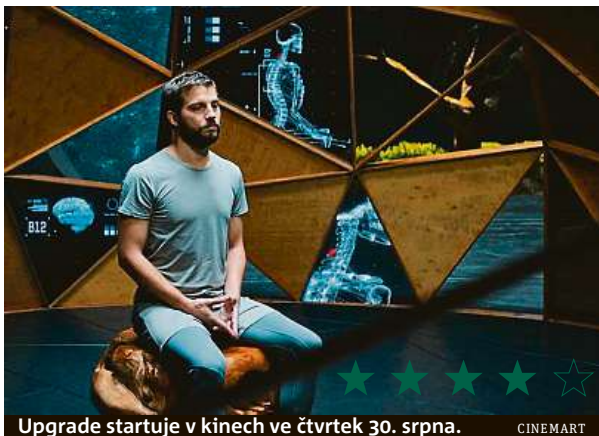
Upgrade startuje v kinech ve čtvrtek 30. srpna.

Až se za pár let probudíme v budoucnosti, jakou nám servíruje nový snímek Upgrade, nebudeme muset hnout ani prstem. Do práce, pokud do nějaké budeme muset, nás odveze automatizovaný taxík bez řidiče, oběd si vytiskneme na tiskárně, a pokud si budeme chtít otevřít pivo sami, můžeme si dát otvírák zabudovat přímo do ruky. Druhý režisérský počín hororového scenáristy filmů, jako je Insidious či Saw Leigha Whannella, ale naštěstí není jen levné sci-fi běčko, jak by se mohlo na první pohled zdát. Kromě krvavých scén a trochy té žánrové ruti-