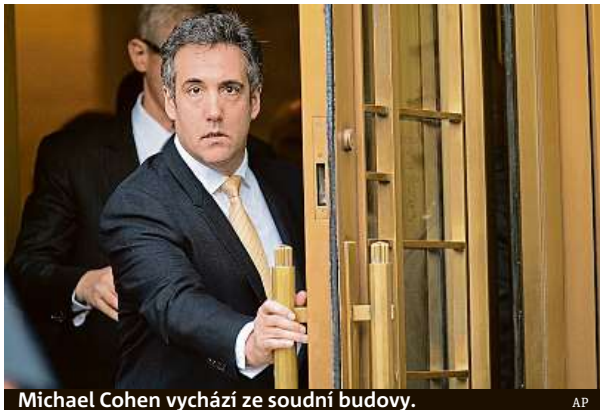
Michael Cohen vychází ze soudní budovy.

„Vystoupil a svědčil pod přísahou, že ho Donald Trump navedl, aby spáchal zločin tím, že zaplatil dvěma ženám, a to za tím hlavním úče-