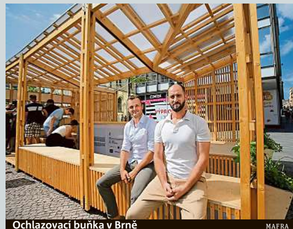
Ochlazovací buňka v Brně