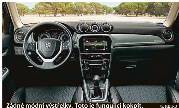
Žádné módní výstřelky. Toto je fungující kokpit.

Nezapomeňme na pohon všech kol. V jízdním módu Lock posíláte více točivého momentu na zadní kola a můžete směle do terénu. Pozor ale na silniční pneumatiky.