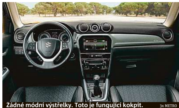
Žádné módní výstřelky. Toto je fungující kokpit.

Nezapomeňme na pohon všech kol. V jízdním módu Lock posíláte více točivého momentu na zadní kola a můžete směle do terénu. Pozor ale na silniční pneumatiky.