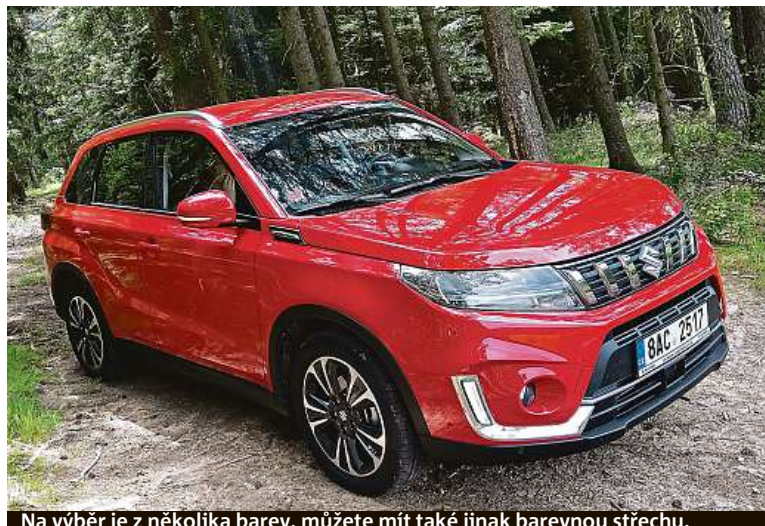
Na výběr je z několika barev, můžete mít také jinak barevnou střechu.