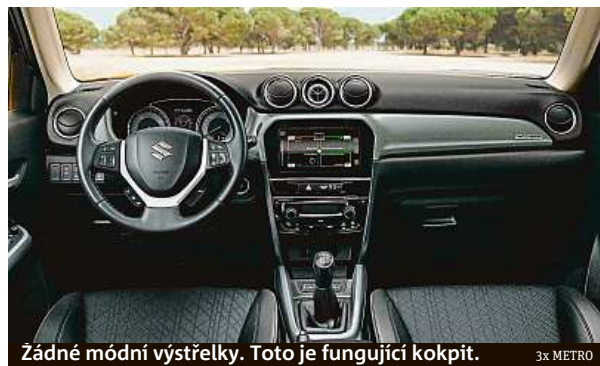
Žádné módní výstřelky. Toto je fungující kokpit.

Nezapomeňme na pohon všech kol. V jízdním módu Lock posíláte více točivého momentu na zadní kola a můžete směle do terénu. Pozor ale na silniční pneumatiky.