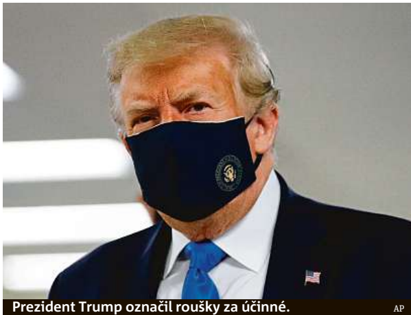
Prezident Trump označil roušky za účinné.

Prezidentovo dlouhé odmítání ochrany úst situaci ve Spojených státech zpolitizovalo.