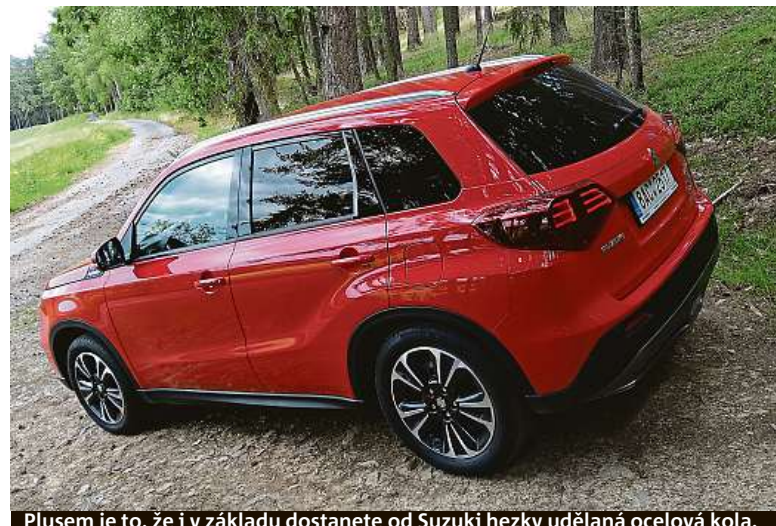
Plusem je to, že i v základu dostanete od Suzuki hezky udělaná ocelová kola.

Suzuki se trefuje do vkusu Čechům. Bestseller Vitara drží vlajku vysoko. Na jedné straně má napsáno výkon, na druhé vlaje cena.