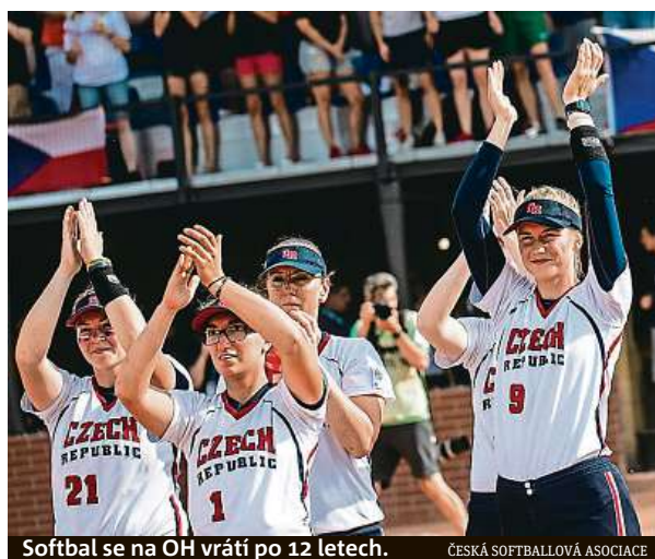
Softbal se na OH vrátí po 12 letech.

Softbalistky trénovaly od konce evropského šampionátu, kde skončily na čtvrtém místě, celkem pět dní. Pálkařky musely čelit více než pěti tisícům nadhozů. Během jednoho tréninku se švihalo na čtyřech stanovištích. „Tato forma finální přípravy je úplně nejlepší. Potřebovaly jsme, aby se trénink co nejvíce podobal zápasům. Bylo to opravdu náročné, i když na nadhozy od mužů jsem už