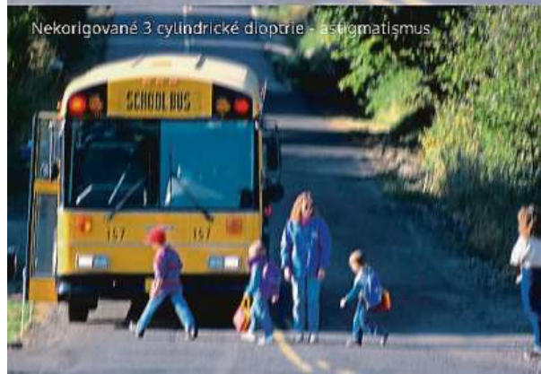
Nekorigované 3 cylindrické dioptrie - astigmatismus