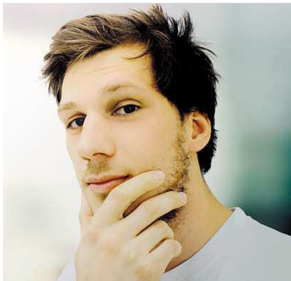
Základní nedostatek: nerozhodnost

Nejlépe pak na tom jsou absolventi vysokých škol, i tam ale existují výhrady: chybí jim schopnosti samostatně se rozhodovat, řešit problém a vést pracovní tým. „Na výsledcích šetření se odráží měnící se situace na pracovním trhu a odlišná očekávání zaměstnavatelů od škol. Zaměstnavatelé totiž mnohdy očekávají, že jim školy poskytnou specializované pracovníky pro konkrétní pozice,“ říká k výsledkům studie Jiří Vojtěch z NÚV. To je prý dáno zatím nízkou spolupra-