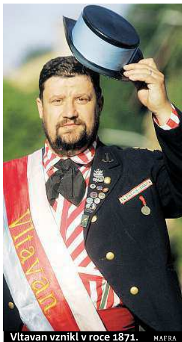
Vltavan vznikl v roce 1871.