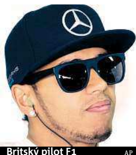
Britský pilot F1

„Kolena jsou v pořádku, ale záda a krk dělají problémy,“ řekl bývalý mistr světa britskému listu The Telegraph.