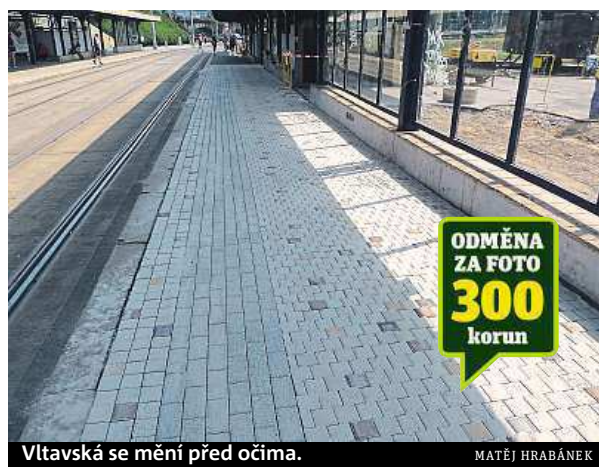
Vltavská se mění před očima.