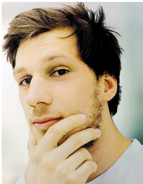
Základní nedostatek: nerozhodnost

Nejlépe pak na tom jsou absolventi vysokých škol, i tam ale existují výhrady: chybí jim schopnosti samostatně se rozhodovat, řešit problém a vést pracovní tým.