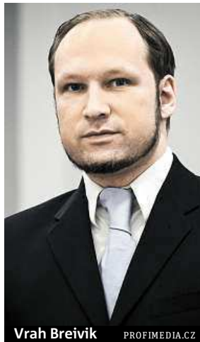
Vrah Breivik

Breivik nejprve ve vládní čtvrti v Oslu odpálil nálož, jež připravila o život osm lidí. O dvě hodiny později extrémista postřelil 69 členů letního tábora sociálnědemokratické mládeže na ne-