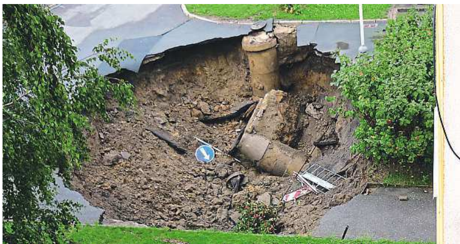
Ráno vykouknete z okna a místo ulice a parčíku na vás zírá hluboký kráter.

Na stejném místě se před dvěma lety propadlo osobní