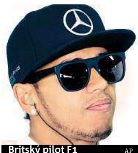
Britský pilot F1 AP

„Kolena jsou v pořádku, ale záda a krk dělají problémy,“ řekl bývalý mistr světa britskému listu The Telegraph.