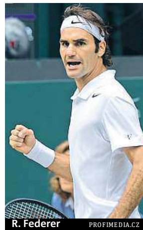
R. Federer

Prekvapivé je šesté místo indického hráče kriketu Mahendry Singha Dhoniho, který je populární zejména v Asii.