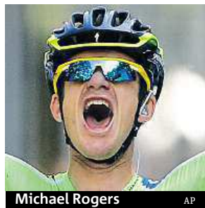
Michael Rogers

Na Tour de France se po volném dnu rozjela další akce a Leopold König opět patřil k nejdůležitějším protagonistům. Ve stoupání na Port de Bales, nejvyšší vrchol dne, sice na ataky hlavních favoritů nestačil, v následném sjezdu však předvedl životní jízdu, v cílovém Bagnères-de-Luchon už byl nalepený za zadním kolem lídra Tour Nibaliho a ve výsledcích si znovu polepšil. Pět dnů před cílem v Paříži už je český cyklista sedmý. Nejdelší etapu 101. ročníku vyhrál Australan Michael Rogers. Celkové pořadí dál vede Vincenzo Nibali. IDNES.cz