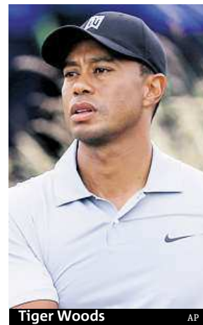
Tiger Woods