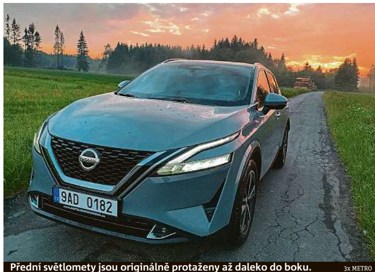
Přední světlomety jsou originálně protaženy až daleko do boku.