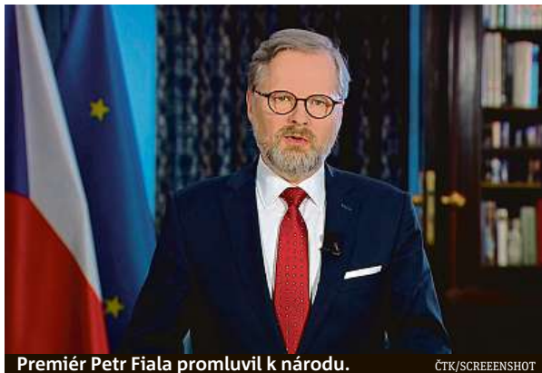
Premiér Petr Fiala promluvil k národu.

„Bohužel, Česká republika patří mezi několik málo zemí, jejichž závislost je v tomto ohledu mimořádně