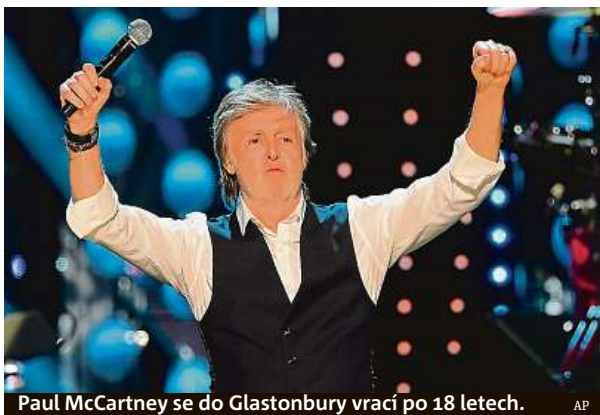
Paul McCartney se do Glastonbury vrací po 18 letech.

Festival na rodinné farmě v anglickém hrabství Somers-