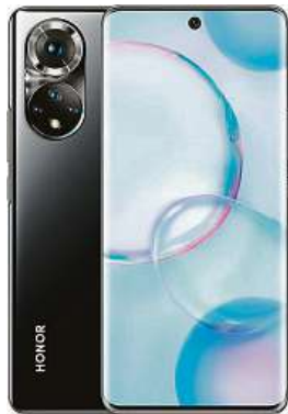
Telefon Honor 50 2x MIRONET

Další předností je velikost displeje 6,57" a neobvyklé rozlišení 2340 x 1080, díky kterému budete mít krásně jemný obraz. Displej společně s elegantním tělem vytvářejí zajímavou kombinaci,