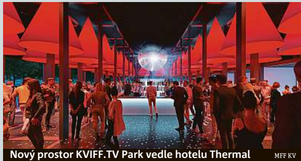
Nový prostor KVIFF.TV Park vedle hotelu Thermal

Na Mezinárodním filmovém festivalu v Karlových Varech opět nebude chybět festivalová televize, jež zprostředkovává veškeré dění, a to v novém multifunkčním prostoru. Konat se tady budou besedy s tvůrci, soutěže, prostor poslouží i jako odpočinková zóna s občerstvením. Podle tvůrců nového prostoru barevnost i zpracování pavilonu odkazují na architekturu hotelu Thermal a vytváří mu moderního souzorce. Pavilon KVIFF.TV Parku sestává z 41 vertikálních a 18 horizontálních modulů.