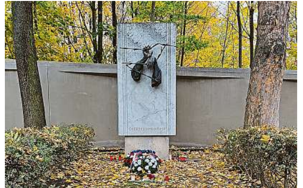
Pietní místo za obětí komunismu