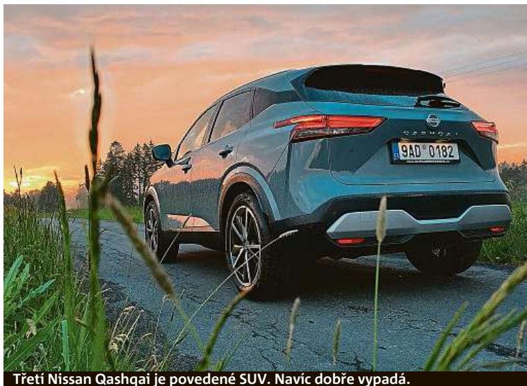
Třetí Nissan Qashqai je povedené SUV. Navíc dobře vypadá.