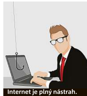
Internet je plný nástrah.

Pro domácnosti je vhodným řešením balík ESET Family Security Pack. Před hrozbami internetu ochrání všechna vaše zařízení a pomůže například při jejich ztrátě či odcizení. Součástí balíku rodinné internetové ochrany jsou licence pro tři počítače s operačním systé-