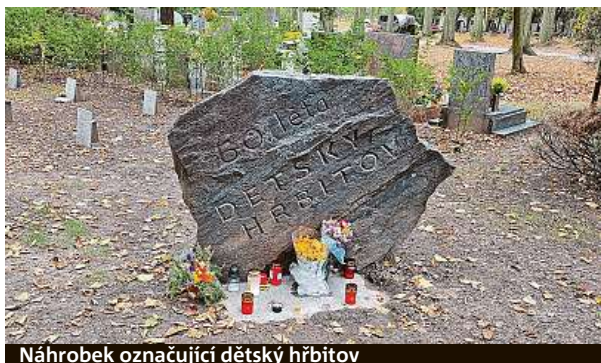
Náhrobek označující dětský hřbitov