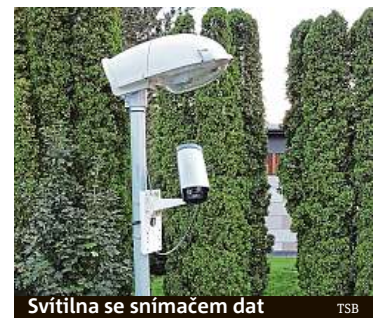
Svítidla se snímačem dat

Liduprázdný svět po ničivé válce. Domy stále fungují. Ale bez lidí. Chod řídí na základě vlastní inteligence počítače. Jak daleko jsme od chvíle, kdy bude tato vize realitou?