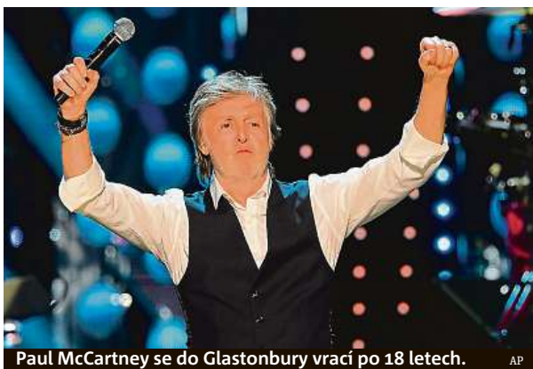
Paul McCartney se do Glastonbury vrací po 18 letech.

Při hlavních třech festivalových večerech (pátek, sobota, neděle) budou program na největší scéně Pyramid Stage uzavírat americká zpěvačka Billie Eilish, člen legendárních Beatles Paul McCartney a nakonec rapper Kendrick Lamar. První dva jmenovaní jsou nejmladším (20 let) a nejstarším (80 let) sólovým „headlinerem“ v dějinách akce.