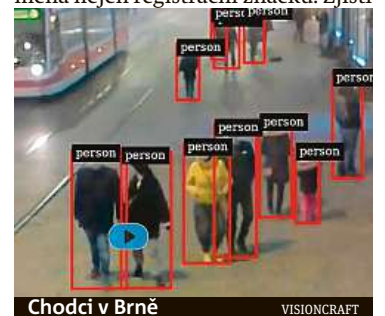
Chodci v Brně

AI, kterou využívají v Brně, zkušebně instalují také v jednom z lomů nedaleko jihomoravské metropole. Snímáče odhalí nákladní auta, která se budou vyhýbat autováze. AI zaznamenaná nejen registrační značku. Zjistí