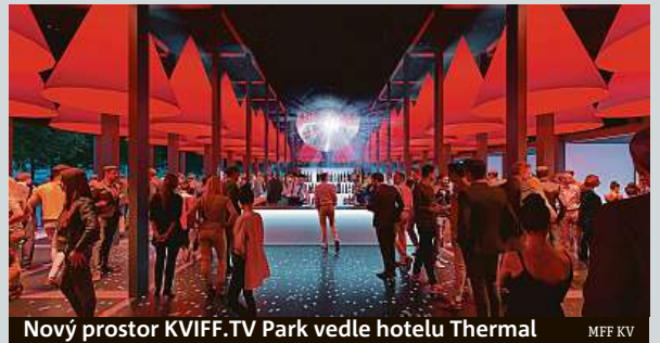
Nový prostor KVIFF.TV Park vedle hotelu Thermal

Na Mezinárodním filmovém festivalu v Karlových Varech opět nebude chybět festivalová televize, jež zprostředkovává veškeré dění, a to v novém multifunkčním prostoru. Konat se tady budou besedy s tvůrci, soutěže, prostor poslouží i jako odpočinková zóna s občerstvením. Podle tvůrců nového prostoru barevnost i zpracování pavilonu odkazují na architekturu hotelu Thermal a vytváří mu moderního souzvučenice. Pavilon KVIFF.TV Parku sestává z 41 vertikálních a 18 ho-