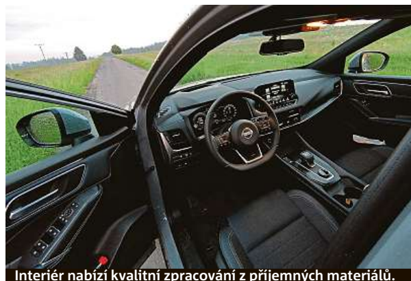
Interiér nabízí kvalitní zpracování z příjemných materiálů.

Nová generace Nissanu Qashqai je prošípaná asistenty. Přítomen je inteligentní adaptivní tempomat, nouzové brzdění před překážkami i při couvání, varování před provozem za autem, sledování mrtvého úhlu včetně zásahu do řízení, prostě všechno, co by nyní mělo takové SUV mít. I uvnitř je bezpečno. Nový nissan byl totiž po uvedení na trh podroben testům bezpečnosti společnosti Euro NCAP a dosáhl na všech pět hvězdiček v hodnocení právě asistenčních systémů, ale také ochrany dospělé i dětské posádky. Ceny za model začínají již na částce 624 tisíc korun.