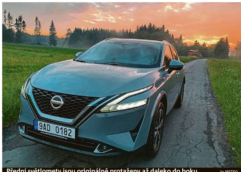
Přední světlomety jsou originálně protaženy až daleko do boku.