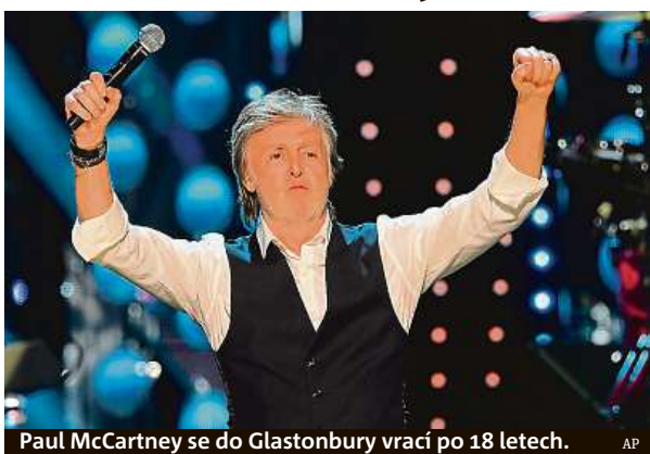
Paul McCartney se do Glastonbury vrací po 18 letech.

Rodinná farma na jihu Anglie přivítá plejádu hvězd v čele se sirem Paulem McCartneym.