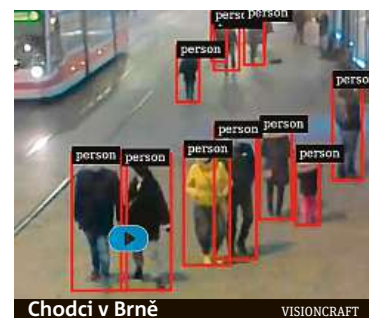
Chodci v Brně

AI, kterou využívají v Brně, zkušebně instalují také v jednom z lomů nedaleko jihomoravské metropole. Snímače odhalí nákladní auta, která se budou vyhýbat autováze. AI zaznamená nejen registrační značku. Zjistí také, jestli nákladník vezl z lomu kamení, šterk, či písek. PAVEL HRABICA