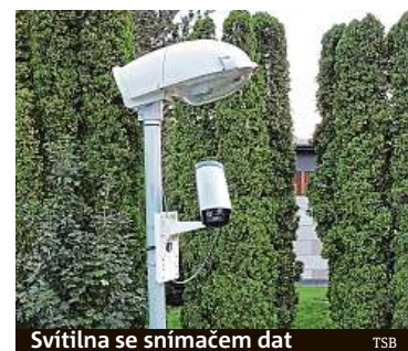
Svítidla se snímačem dat

Povídka Přijdou vlahé deště od Raye Bradburyho je z roku 1950. Liduprázdný svět po ničivé válce. Domy stále fungují. Ale bez lidí. Chod řídí na základě vlastní inteligence počítače. Jak daleko jsme od chvíle, kdy bude tato vize realitou?