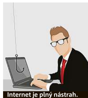
Internet je plný nástrah.

Pro domácnosti je vhodným řešením balík ESET Family Security Pack. Před hrozbami internetu ochrání všechna vaše zařízení a pomůže například při jejich ztrátě či odcizení. Součástí balíku rodinné internetové ochrany jsou licence pro tři počítače s operačním systé-