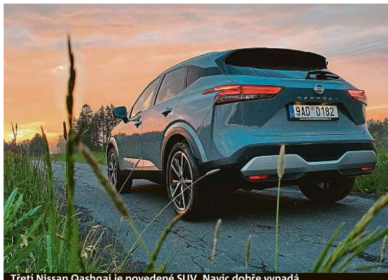
Třetí Nissan Qashqai je povedené SUV. Navíc dobře vypadá.