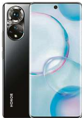
Telefon Honor 50 2x MIRONET

Další předností je velikost displeje 6,57" a neobvyklé rozlišení 2340 x 1080, díky kterému budete mít krásně jemný obraz. Displej společně s elegantním tělem vytvářejí zajímavou kombinaci,