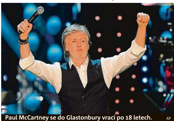
Paul McCartney se do Glastonbury vrací po 18 letech.

Festival na rodinné farmě v anglickém hrabství Somers-