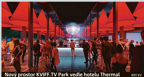
Nový prostor KVIFF.TV Park vedle hotelu Thermal

Na Mezinárodním filmovém festivalu v Karlových Varech opět nebude chybět festivalová televize, jež zprostředkovává veškeré dění, a to v novém multifunkčním prostoru. Konat se tady budou besedy s tvůrci, soutěže, prostor poslouží i jako odpočinková zóna s občerstvením. Podle tvůrců nového prostoru barevnost i zpracování pavilonu odkazují na architekturu hotelu Thermal a vytváří mu moderní souzorence. Pavilon KVIFF.TV Parku sestává z 41 vertikálních a 18 horizontálních modulů.