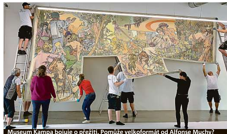
Museum Kampa bojuje o přežití. Pomůže velkoformát od Alfonse Muchy?