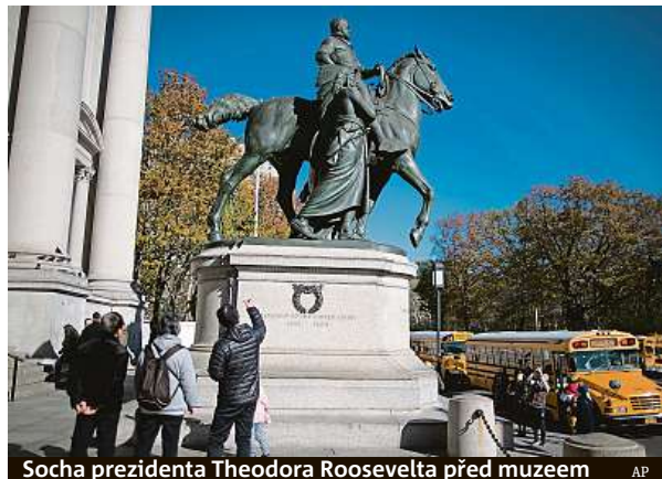
Socha prezidenta Theodora Roosevelta před muzeem

Starosta uvedl, že vyhověl žádosti vedení muzea. Podle de Blasie socha zobrazuje černochocha a domorodé obyvatele Ameriky jako porobené a ra-