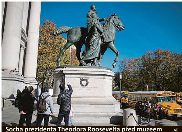
Socha prezidenta Theodora Roosevelta před muzeem

Starosta uvedl, že vyhověl žádosti vedení muzea. Podle de Blasie socha zobrazuje černochy a domorodé obyvatele Ameriky jako porobené a ra-