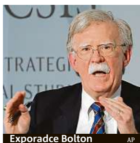
Exporadce Bolton

Bolton je aktuálně v centru pozornosti amerických mé-