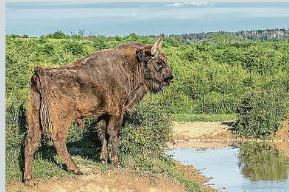
Rezervaci obývají třeba zubři.