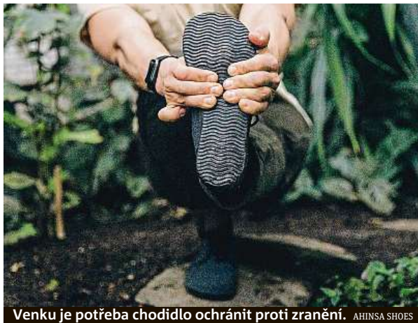
Venku je potřeba chodidlo ochránit proti zranění. AHINSA SHOES

Špatné návyky chůze vznikají podle ortopeda Míchala Buriana již v raném věku. „Často dochází k chybnému