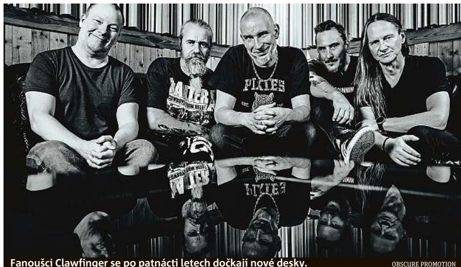
Fanoušci Clawfinger se po patnácti letech dočkají nové desky.

Pětice hudebníků nechala fanoušky čekat na nové album dlouhých patnáct let. První vlašťovkou z chystaného studiového počínu je skladba Environmental Pa-