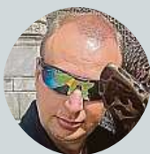
Martin Irein Východočeské. „Musím k bráchoj s velkou krabicej.“