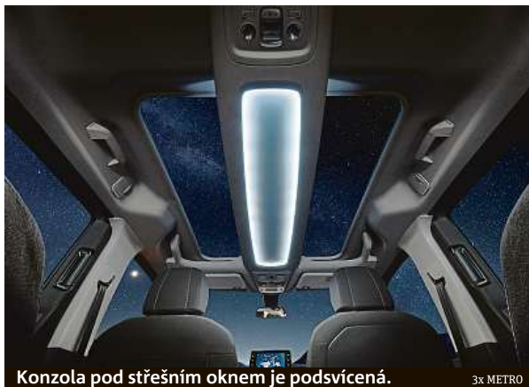
Konzola pod střešním oknem je podsvícená.