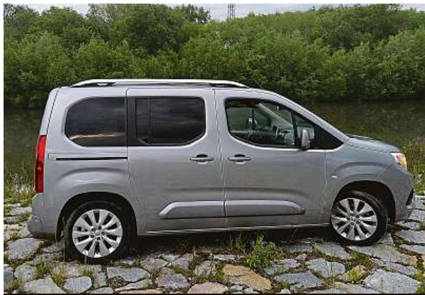
Combo má stejný podvozek jako Partner i Berlingo.