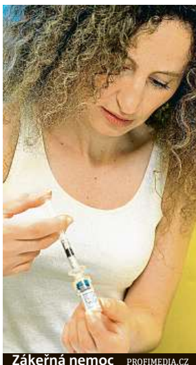
Žákečná nemoc

„Česká republika patří k zemím s vysokým výskytem roztroušené sklerózy, nemoc má