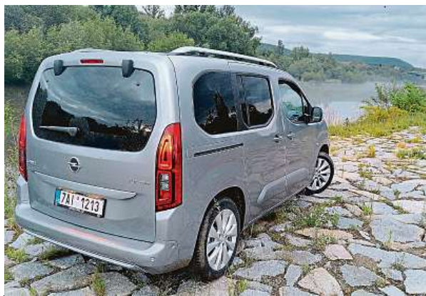
Výška auta je 1,8 metru. Takže máte dost místa nad hlavou.