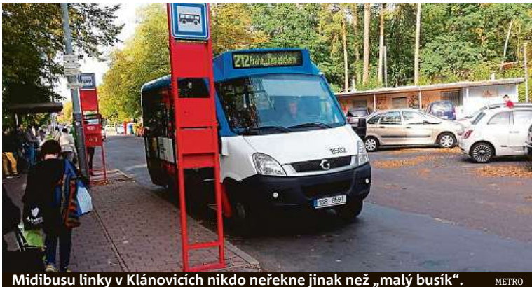
Midibusu linky v Klánovicích nikdo neřekne jinak než „malý busík“.

Linku 212, jež vozí cestující na vlak, čeká od ledna změna dopravce. Místní o něj však nestojí.