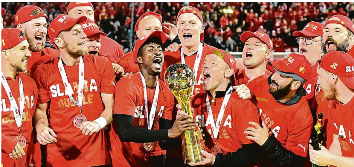
Fotbalisté Slavie slaví po ligovém titulu také vítězství v MOL Cupu. Baník ve finále porazili 2:0. Více na straně 23

Marnotratnost je mýtus. Paní i slečny nejvíce pořizují zboží v kamenných obchodech. Souboj pohlaví. V utrácení pro radost je to půl na půl. Hodnotnější dárky. Pro sebe si je koupí mnohem více mužů STRANA 8