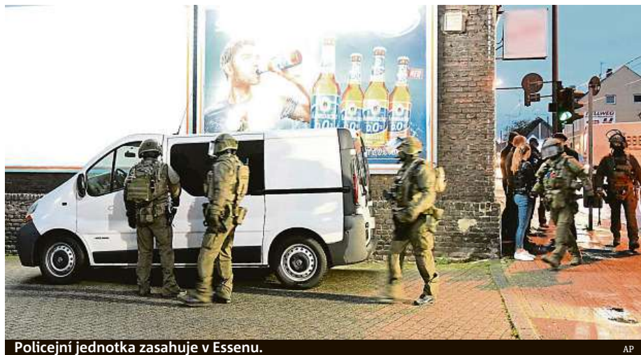
Policejní jednotka zasahuje v Essenu.

Policie skupinu motorkářů původem z Iráku sledovala již delší dobu. Její členy podezřívá z pašeráctví lidí, ale také z obchodování s drogami a nelegálního obchodování se zbraněmi či falšování úředních dokumentů, především občanských průkazů, pasů a vysvědčení o znalosti jazyka. ČTK a MET