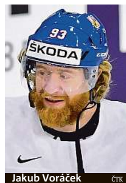
Jakub Voráček