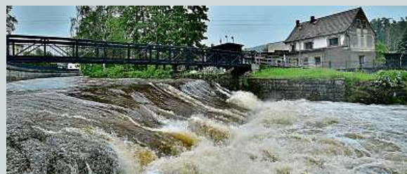
Snímek byl pořízen v Jizerských horách.

Extremní déšť včera zasáhl některé části Česka. Proudů vody valící se po svazích, zatopené sklepy i hnůj spláchnutý na hřiště. Tak to vypadalo na východě Česka, kde velká voda vyhnala lidi i z postelí. Velké problémy byly také na Zlínsku. Hodně přšet má i dnes. IDNES.cz