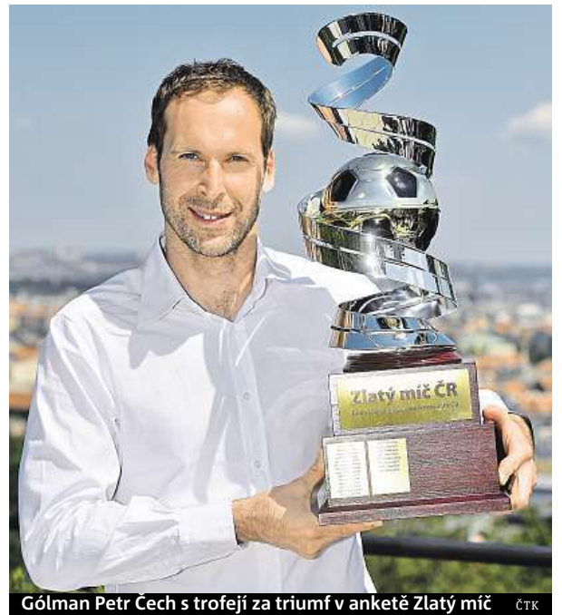
Gólman Petr Čech s trofejí za triumf v anketě Zlatý míč ČTK