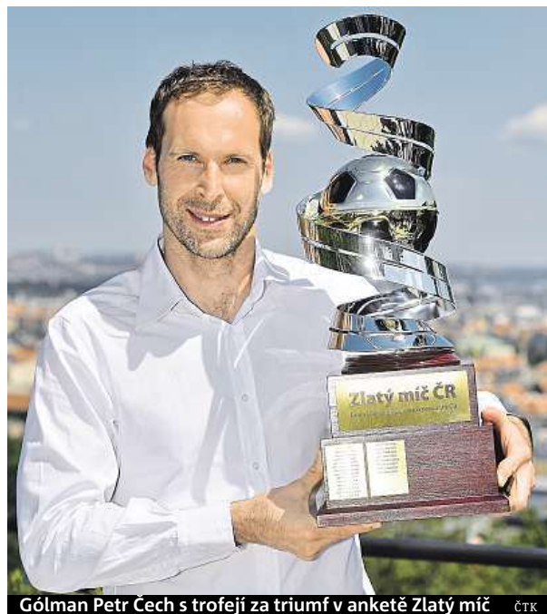
Gólman Petr Čech s trofejí za triumf v anketě Zlatý míč ČTK