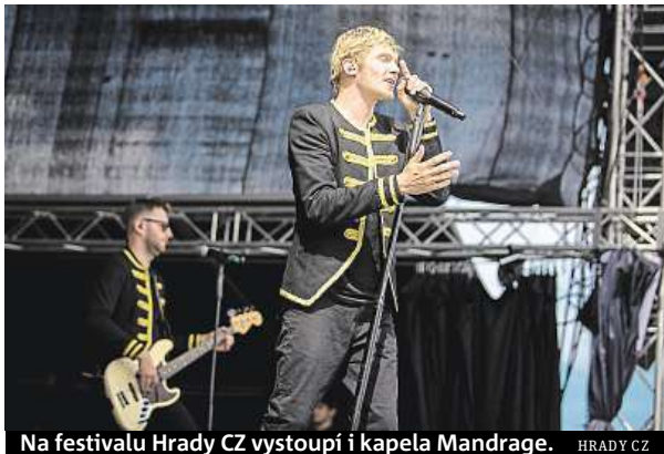
Na festivalu Hrady CZ vystoupí i kapela Mandrage.

Čtrnáctému ročníku putovního festivalu budou v prostředí památek dominovat Divokej Bill, Tomáš Klus, Mandrage a nově Lenny, Jelen či Slza.