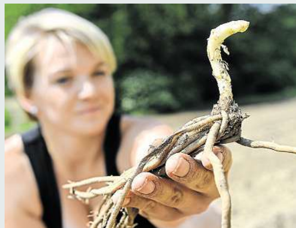
Chřest dává úrodu 20 let, na pěstování je náročný. ČTK

Po půl století obnovily Ivančice pěstování chřestu. První sazenice se tento týden objevují na poli města. První sklizeň se očekává v roce 2020. Chřest kdysi jako vybraná lahůdka a chuťově vynikající zelenina mířil na císařský stůl do Vídně, ale například i do Říma. Od 70. let minulého století z jídelníčku mizel. ČTK