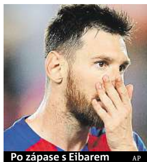
Po zápase s Eibarem

Fotbalový kanonýr Lionel Messi z Barcelony získal počtvrté v kariéře Zlatou kopačku určenou pro nejlepšího střelce evropských lig. Během sezony nastřílel 37 gólů a vyhrál před Basem Dostem ze Sportingu Lisabon, který v Portugalsku dal 34 branek. Argentinská superstar získala Zlatou kopačku už v sezonách 2009/2010, 2011/2012 a 2012/2013, ve které zaznamenala rekordních 50 gólů. Druhé místo by podle počtu branek (35) mělo připadnout Edinsonovi Cavanimu z PSG, ale francouzská liga má nižší koeficient. Ten ho odsunul až na devátou příčku. ČTK