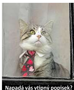
Napadá vás vtipný popisek?

Napište bublinu a reagujte na sloupek na: www.facebook.com/denikmetro