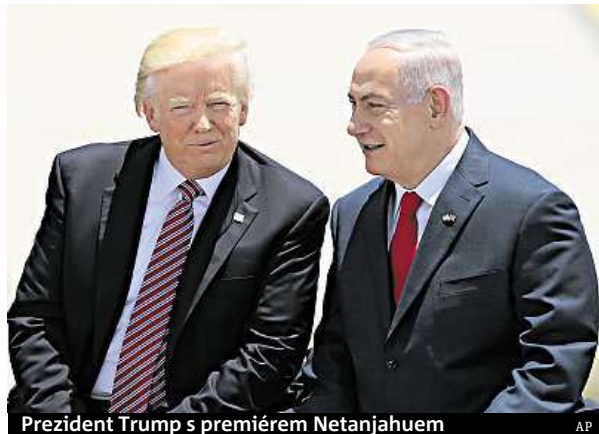
Prezident Trump s premiérem Netanjahuem

Trump v projevu po přeletu řekl, že přicestoval do Izraele, aby potvrdil pevné pouto mezi USA a Izraelem. „Máme před sebou výjimečnou příležitost přinést stabilitu do tohoto regionu a porazit terorismus.“